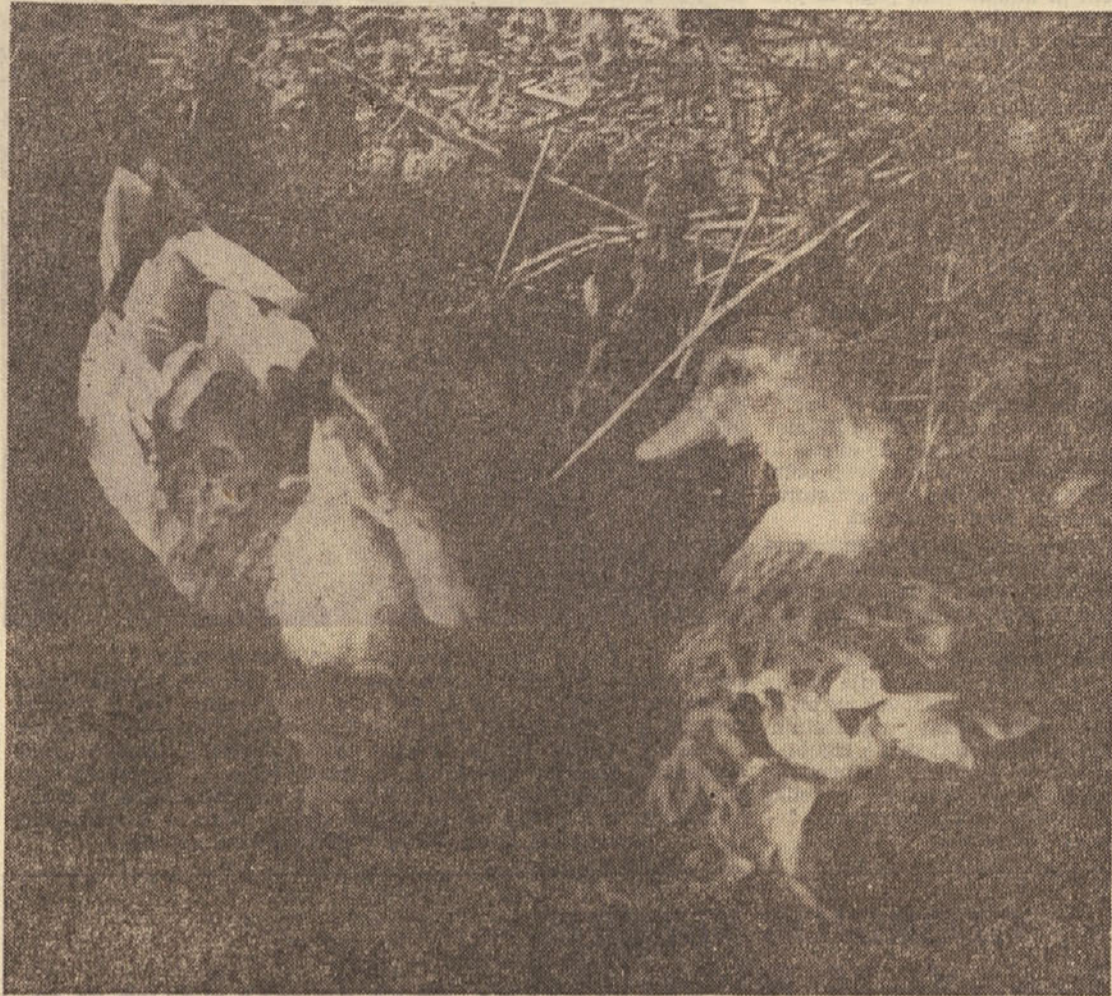
»Srečanje«. — Delo krožka v osnovni šoli. Skoraj vse, kar je na sliki manj pomembno, je zabrisano. Tako imenovana diagonalna kompozicija je nastala sama po sebi, ne da bi učenci kaj vedeli o njej