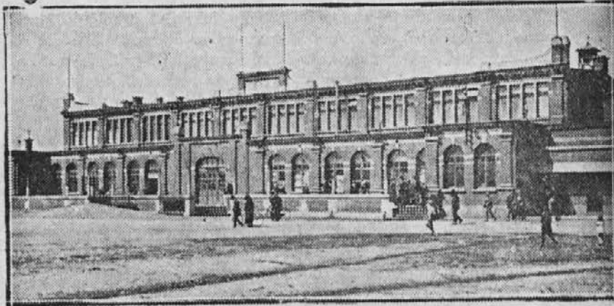
„ DE KRING “, kjer se prodaja nas list, WATERSCHEI.

Pismo flamskega g. župnika iz Waterschei - Belgija.