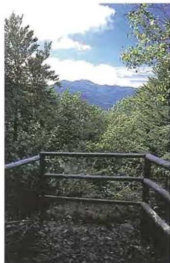
Slika 2: Pogled na Snežnik z Anine skale na Mašunski gozdni učni poti