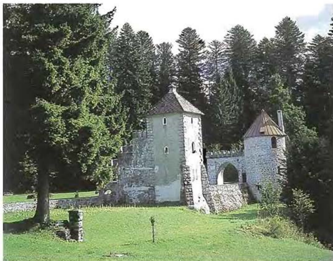
Slika 1: Stolpa nekdanjega Schönburgovega lovskega gradiča na Mašunu

V bližini gostilne je že vrsto let kratko smučišče z vlečnico, v dolini med cesto in lovskim gradičem pa je zelo primerno sankališče in smučišče za otroke in začetnike. Zato je Mašun tudi pozimi zelo obiskana izletniška točka.