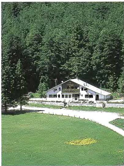
Slika 3: Planinski dom na Sviščakih

V zasebnih gozdovih ne pričakujemo bistvenih motenj lesnoproizvodne vloge. Zaradi povečane stopnje poudarjenosti socialnih vlog naj bi bili lastniki gozdov ob najbolj obiskanih cestah in poteh upravičeni do višjih subvencij za gojitvena in varstvena dela.