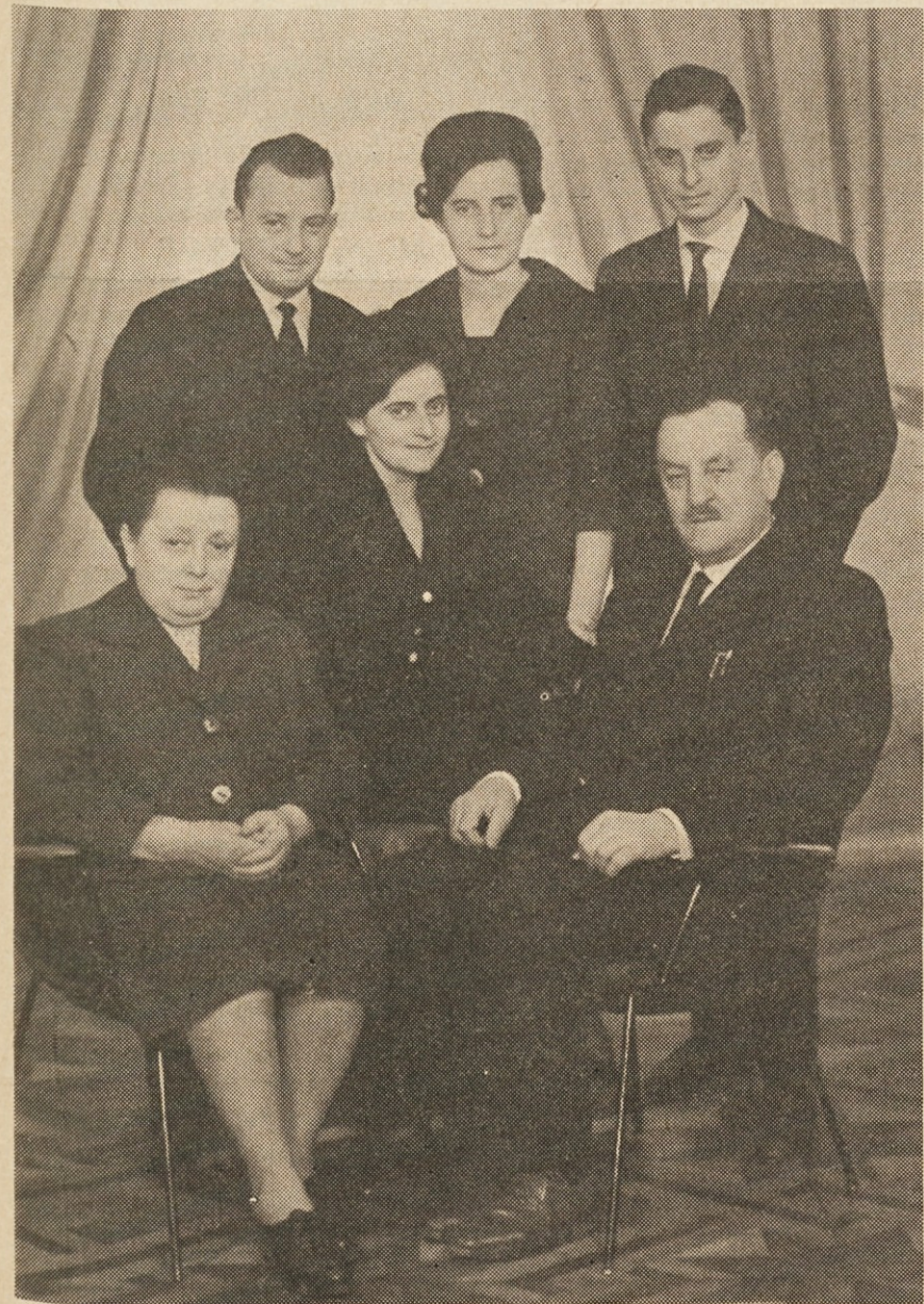
Slavljenec s svojo družino

Nekaj dopisov smo morali preložiti za drugič zaradi tehničnih zaprek. Prosimo za razumevanje.