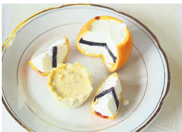
Mandljeva zmrzlina in pomaranče (Vodnik, Kuharske bukve, 1799)