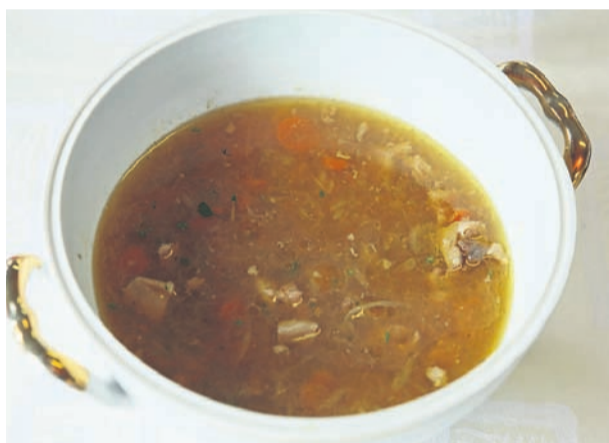
Zeliščna juha (Vodnik, Kuharske bukve, 1799)