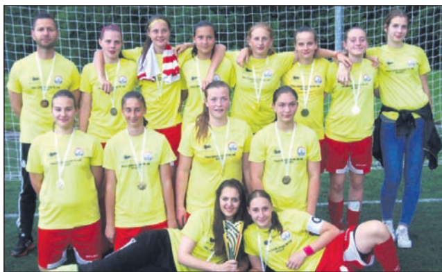
Ekipa ŽNK MSM Ptuj U-15 je zaslužno osvojila naslov prvakinj.

Sledil je veliki finale, v katerem so se varovanke Uroša Šmigoca pomerile z domačinkami, vrstnicami ŽNK Radomlje. Tudi to tekmo so Ptujčanke dobile z rezultatom 2:1 (2:1) in se tako veselile zgodovinskega uspeha in prvega naslova državnih prvakinj.