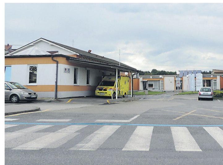
Solastniški deleži občin so v odloku o preoblikovanju Javnega zavoda 46,38 %, Občina Sv. Jurij v Slovenskih goricah 12,63 %, Občina Sv. Trojica Benedikt 14,62 % ter Občina Sv. Ana v Slovenskih goricah 13,75 %.

funkciji strokovnega vodja in direktorja ZD z odlokom združeni v eni osebi. »V enem izmed členov piše, da je direktor zavoda tudi strokovni vodja zavoda. Zdi se mi, da ima tako preveč manevrskega prostora. Zagotovo je v ZD nekdo, ki bi lahko bil dober strokovni vodja. Če sem čisto