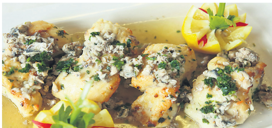
Pečen som (Vodnik, Kuharske bukve, 1799)