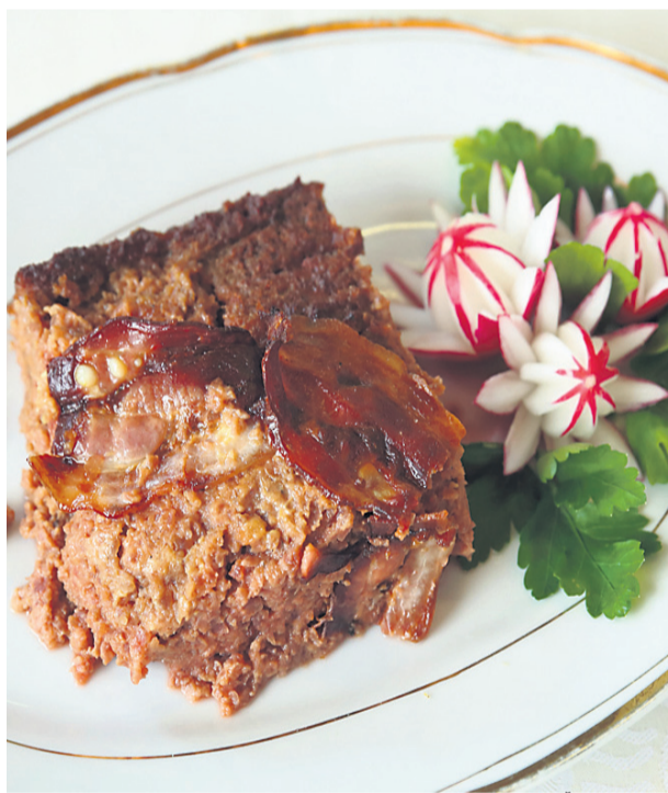
Puding iz pese (Vodnik, Kuharske bukve, 1799)