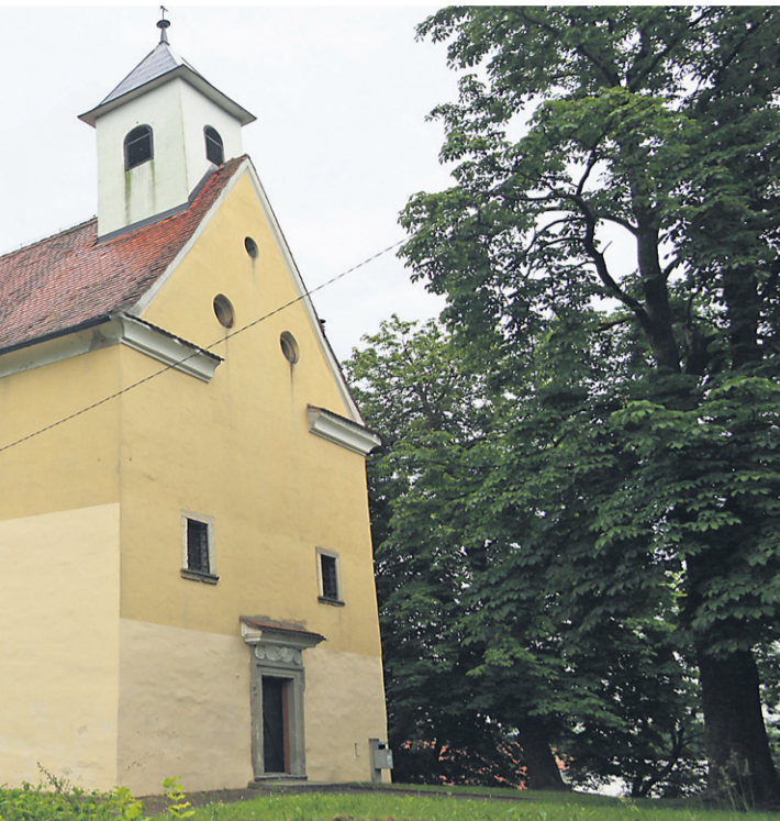
in mestnega stolpa zamenja.

gledna točka, s katere bi pod seboj imeli celotno mesto jedro realizirati, je več. Ena izmed teh je ta, da občina cerkev pri sv. Lastništvo je namreč pogoj za kandidiranje za evropska sred-