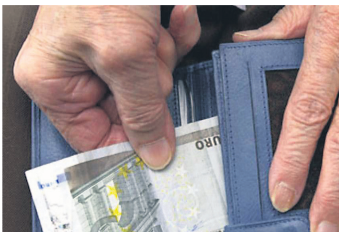
Fotografija je simbolična.

Ormoški policisti so z zbiranjem obvestil še ugotovili, da je neznanec vozil osebni avto znamke Škoda fabia bele barve (domnevna delna reg. štev. ZG 25...), v katerem je bila tudi neznanica ženska. »V vozilu sta se prevažali dve osebi, in sicer ženska neznanega opisa ter neznan moški, ki je govoril v hr-