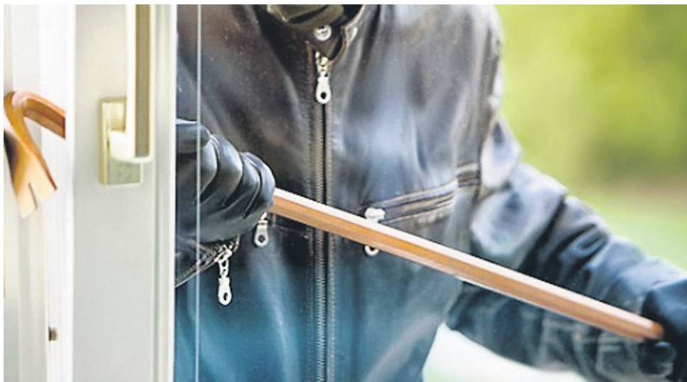
Fotografija je simbolična.

Povedali so, da je tem vlomom skupno, da so storilci vlamljali v novogradnje in odnašali različne gradbene elemente, stavbno pohištvo ipd. Pri policistih smo tudi preverili, ali drži informacija, da naj bi bila preiskava v zvezi z vlogi v novogradnje opravljena tudi v Makolah. Na PU Maribor tega podatka niso zavrnil niti potrdili, odgovorili pa so: »Navedena preiskava intenzivno poteka že dalja časa in še ni zaključena. 23. maja smo v povezavi z obravnavanimi kaznivimi dejanji dvema osumljencema odvzeli prostost, izvedli več hišnih preiskav in pri tem zasegli