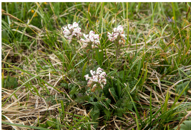
Slika 3: Mayerjev ušivec ( Pedicularis × mayeri ) pod Vrhom Hribcev na grebenu Rušnati vrh – Meja.

večinoma na gorenjskih (bohinjskih) pobočjih: pod Matajurskim Vrhom, Malim Raskovcem (o uspevanje tega križanca na tem nahajališču smo domnevali že pri opisu novega taksona, glej DAKSKOBLER & VREŠ, ibid. ), Rušnatim vrhom in njegovim grebenom proti Meji. Še dve novi nahajališči sta v Bohinju. Eno je v Triglavskem pogorju, pod Viševnikom, drugo na Komni (na stiku Tolminsko-Bohinjskega in Triglavskega pogorja). Dve novi nahajališči sta na Bovškem – v pogorju Bavškega Grintavca in v Kaninskem pogorju. Mayerjev ušivec ima po zdajšnjem vedenju v Julijskih Alpah največ nahajališč v Tolminsko-Bohinjskem pogorju. Verjetno je njegovo pojavljanje tudi v Krnskem pogorju in v zahodnih Julijskih Alpah v Italiji.