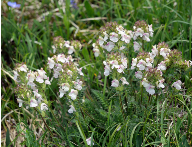
Slika 1: Mayerjev ušivec ( Pedicularis × mayeri ) pod Malim Babanskim Skednjem.

Figure 1: Pedicularis × mayeri under Mali Babanski Skedenj in the Kanin mountains.