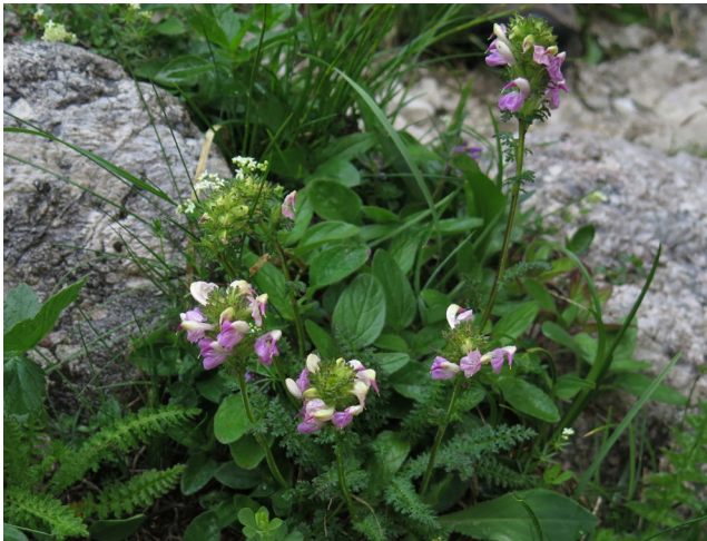
Slika 2: Mayerjev ušivec ( Pedicularis × mayeri ) na Komni.

V Karavankah in grebenu Košute smo Mayerjev ušivec opazili tudi pod Tegoško goro, a smo bili z obiskom prepozni (20. 7. 2021, det. I. Dakskobler, B. Anderle, J. Lango & B. Zupan, fotografija odcvetelega primerka). Nahajališče je na nadmorski višini 1850 m, v sestoji asociacije Ranunculo hybridi-Caricetum sempervirentis . V letu prvega opisa smo novega križanca našli še pod goro Vrh Škrli nad dolino Tolminke.