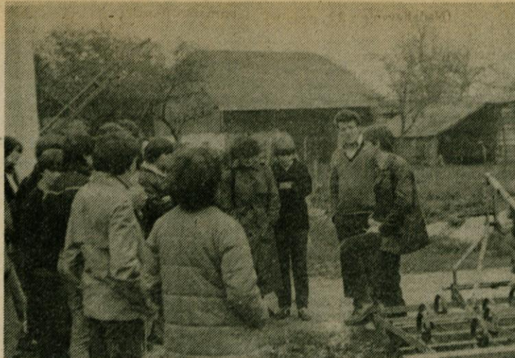
Tovariša Ložar in Brezovar sta dijakom pripovedovala o usmerjenem kmetijstvu...

skupina je pod vodstvom učitelja-mentorja obravnavala problem prehrane s svojega področja. Področja so bila: kemija, fizika, biologija, zdravstvena vzgoja, obramba in zaščita, tehnologija in proizvodnja, geografija, samo upravljanje.