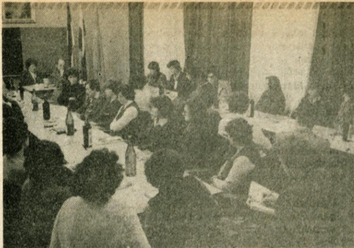
Posvet o aktualnih vprašanih družbenega varstva otrok v domžalski občini je pokazal, da imamo na tem področju opraviti še obilo dela