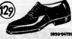
Solidni, enostavni in elegantni spičasti čevlji izdelani iz dobrega boksia z usnjenimi podplatom in usnjeno peto. Spadajo v skupino naših najboljših čevljev „Nai ponos“.