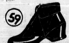
Celogumijasti ženski čevlji za sneg, s toplo flanelasto podlogo in srednje peto. Okrašeni so s elegantnim barvno našim ornamentom.