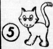
Maček Marko lisec stari deci Vaši veselje pravi.

NAŠA OBUTEV IZ USNJA IN GUME OHRANILA VAM BO ZDRAVLJE IN PRIHRANILA DENAR