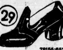
Ženske galoške s široko peto, v katero dobro jede vsak čevlji. Podplaten okrašen jasek varuje nogavice pred dožem in blatom.