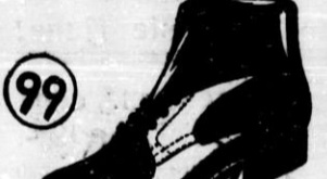
Moški čevlji iz boksia z usnjenimi notranjimi in z močnim nepremočljivim in neraztrljivim gumijastim podplatom. Vselej svoje vzdržljivosti in čevlji prenesejo vsak strapac, a po svoji obliki lahko nadomestijo praznično čevlje.