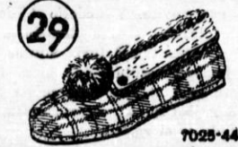
Tople copate z usnjenim podplatom in filcom. Obrobjene svilo in okrašene s lepimi kokardi. Potrebne vsaki gospodinj.