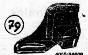
Lehki pa vendar topli čevlji iz trnega sukna, okrašeni z krimerjem in lakasto kapico. Zapravljajo se z zapenki.