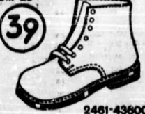
Visoki otroški čevlji iz mehkega rjavega usnja. Njihova široka oblika vstvari higijenskim zahtevam obutve za majhne otroke.