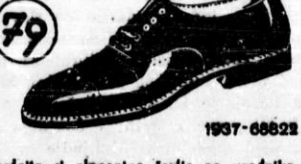
Pogledite si elegantne čevlje za uradnike, trgovca in obrtnika, izdelane iz boksia in neraztrljivim podplatom. Prodejamo jih v črni in rjavi barvi za prav tako sniženo ceno, po Din 70.