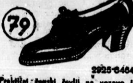
Praktični ženski čevlji na vezavo iz rjavoga ali črnega bombaža z usnjenim podplatom in usnjeno peto.