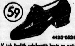
V teh čevljih udobnejša kroja se počuti Vaša noga prav prijetno. Izdelani so iz trnega, čistega in spornim, okrasom iz jase.