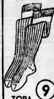
Trajno in močno nogavice iz najboljšega bombaža, stanejo Din 9.