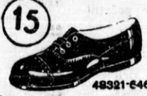
Čevljički na vezavo izdelani iz lakirane gume z močnim gumijastim podplatom. Ne prepuščajo vode in stanejo samo Din 15. 19. in 25.