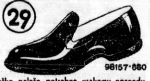
Moške galoške potrebne vsakemu gospodu, ako hoče varovati dom pred snegom in blatom, svoje noge pa pred mrzotami in vlago. Pojzane so v preglbu pa tudi podplat je pojzane.