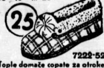
Tople domače copate za otroke, izdelane iz volnenega dubla z usnjenim podplatom in toplim medpodplatom. Okrašeni so z bogatim topkom. Stanejo samo Din 25.