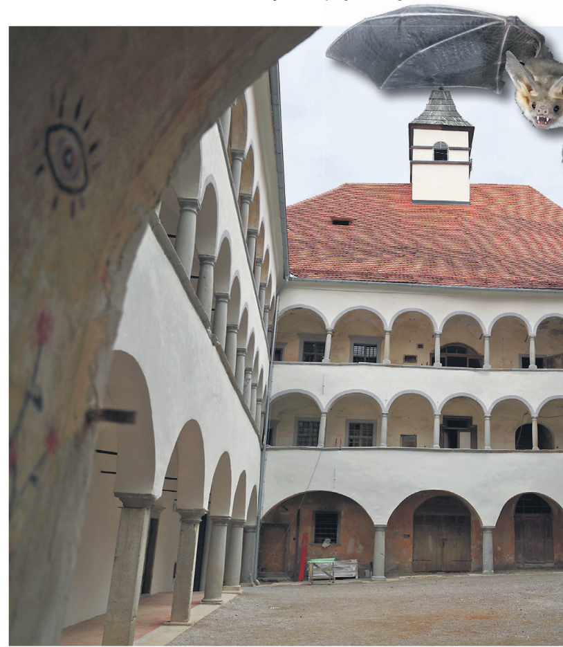
Sredstev iz projekta Življenje netopirjev v gradovih ne bo.

V lanskem letu so se za ta korak odločili zaradi zavrnitve kulturnega ministrstva in posledično izpada gradu Borl ter težav z nekaterimi drugimi partnerji. V letošnjem letu pa zaradi nepripravljenosti Ministrstva za okolje in prostor (MOP), da bi sofinanciralo LIFE projekte. »To