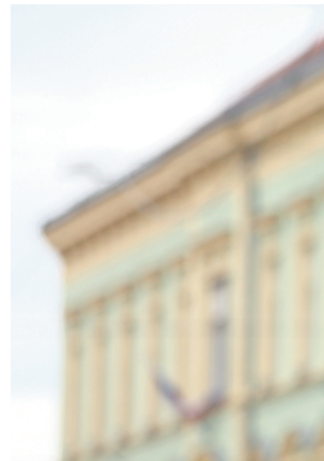
Zavod za turizem Ptuj ima zadnje leto težko

A zaradi vnovičnega zapiranja države jeseni lani se je spomladanski izpad le še poglobil. Statistika na letni ravni kaže precejšen upad števila gostov. V letu 2020 so na Ptuj zabeležili 32.138 prihodov in 90.845 nočitev, kar je 52 % manj prihodov in 41 % manj nočitev v primerjavi z letom 2019.