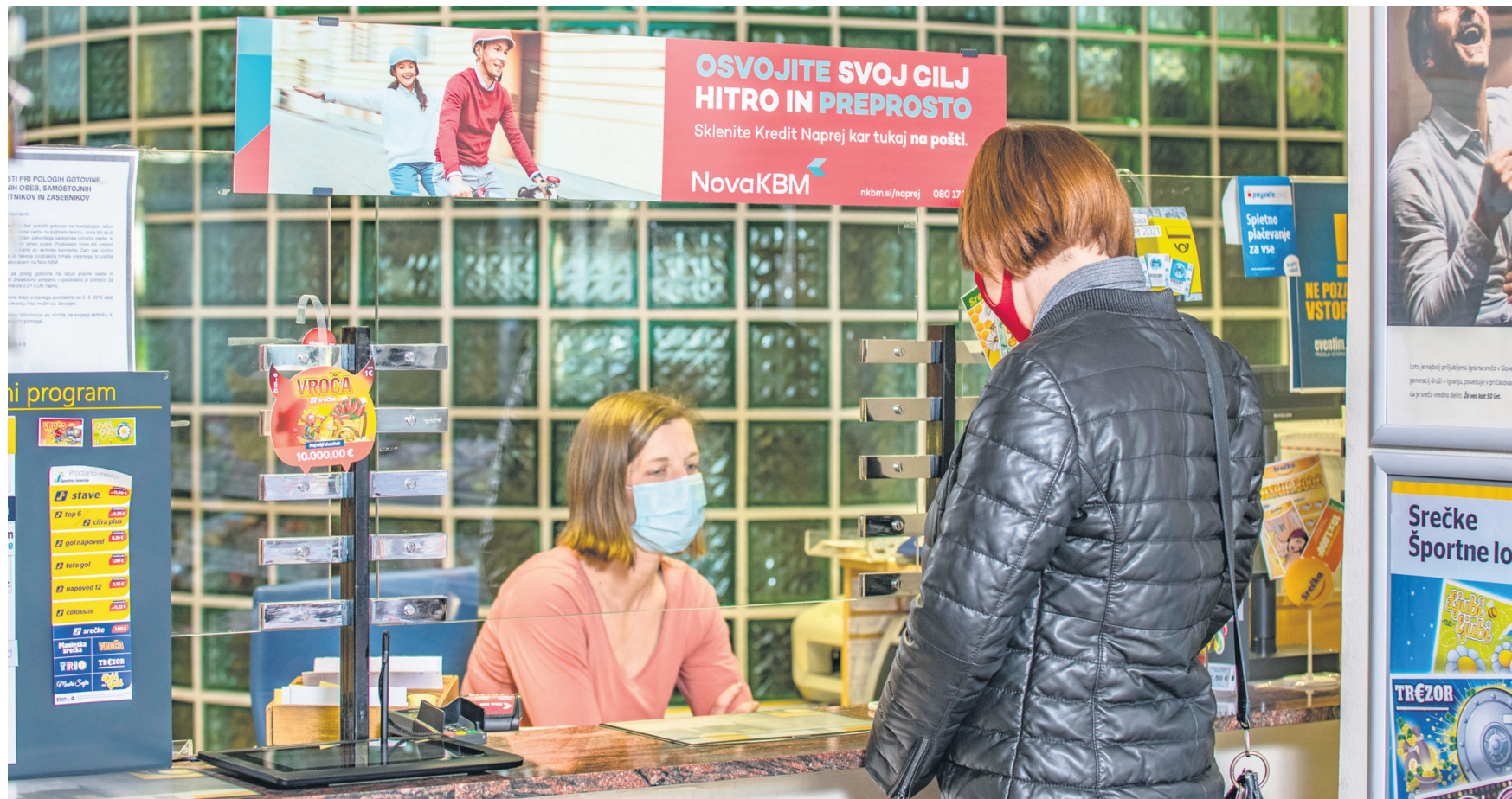
Najpogostejše bančne storitve lahko vse stranke Nove KBM v Spodnjem Podravju opravljajo tudi na poštah.

V preteklem letu se za marsikoga niso spremenile zgolj nakupovalne in potrošniške navade, temveč tudi način, kako urejamo osebne finance, nakupujemo in plačujemo. Kar je bilo še nedavno izbira predvsem mladih, je danes vse bližje tudi mladim po srcu. V Novi KBM opažajo, da izbira spletne in mobilne banke postaja najbolj priljubljen način uporabe bančnih storitev. Aktivacija spletne banke je zelo preprosta in traja le nekaj trenutkov, za to pa ni treba v poslovalnico. Tako so v Novi KBM registrirali tudi 97-letnega uporabnika spletne banke, ki je postal najstarejši znan uporabnik najboljše spletne banke leta 2020 po raziskavi spletnega bančništva v Sloveniji, pa tudi sicer število aktivnih uporabnikov spletne in mobilne banke, starejših od 60 let, vztrajno narašča. Z uporabo spletne in mobilne banke lahko prihranimo pri stroških bančnega poslovanja, hkrati pa je ta varna in hitra, saj je večino storitev mogoče opraviti brez obiska poslovalnic Nove KBM.