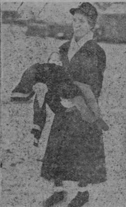
Sovjeti bombardirajo vseprek, največ civilno prebivalstvo. Fins- ska mati nese od bombe ranje- nega otroka na obvezovališče.