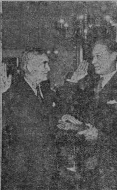
Karel Edison, sin velikega ameri- škoga izumitelja, pri zaprisegi kot novi mornariški minister Zedinje- nih držav