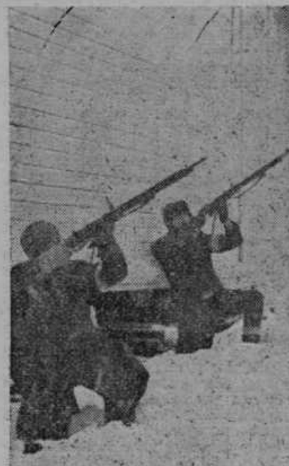
Sovjetska letala zelo pogosto le- tajo nad Finsko. Slika nam pred- stavlja dva posebno izurjena fins- ska strelca »pri delu«