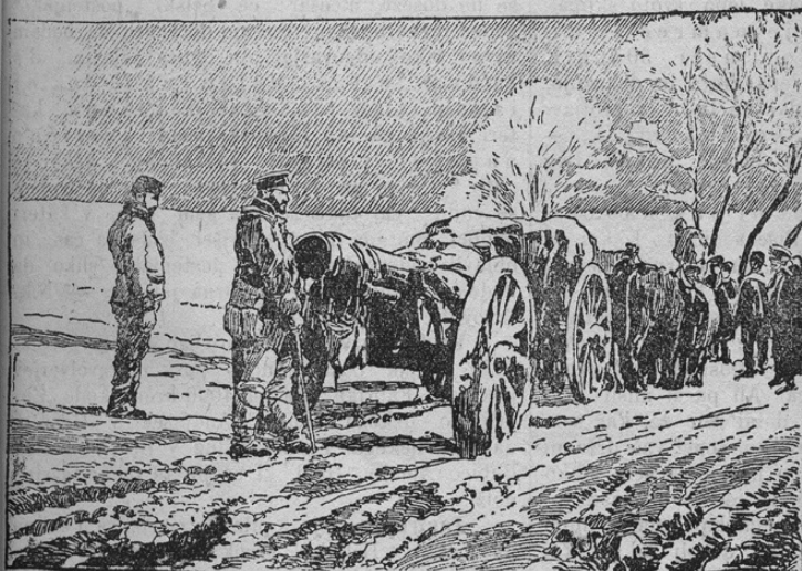
Schwere bulgarische Geschütze vor Tschataltscha.

V času primirja so Bulgari seveda še hušje priprave za novo vojno delali. Zlasti pred Štáaldšo so pripeljali še celo vrsto težkih kanonov, da razrušijo z njimi tamošnje lahke turške utrdbe in pripravijo splošni napad. Naša slika kaže težko vojni take velike havbice pred Štáaldšo.