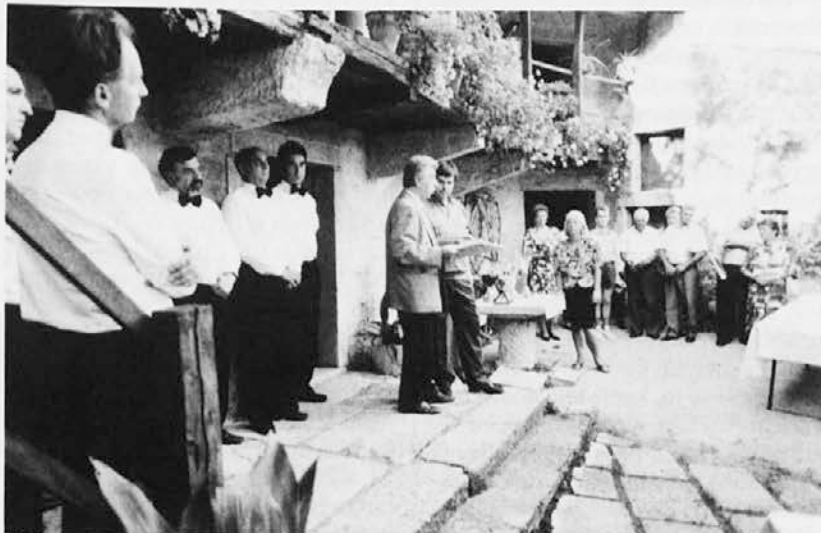
Nagrajevanje najboljših vin na 32. razstavi terana in belih vin v občini Repentabor