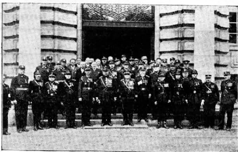
Po skupščini čehoslovaškega hašičkega svaza dne 20. maja pred trgovsko in obrtno zbornico zbrano gasilstvo

Z radostnim srcem se spominjamo na one predvojne čase, ko smo v znano silno težavnih prilikah skupno z vami, mili naši bratje, ramo ob rami gradili lepo zvezo vseh slovanskih