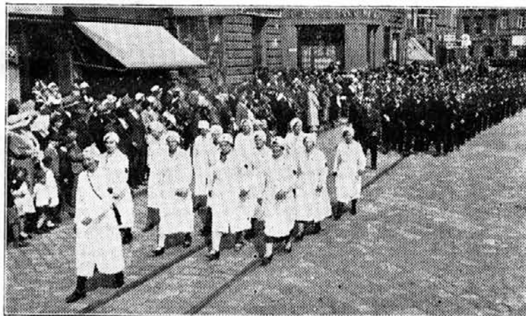
Skupina čehoslovaških samaritank v obhodu po ulicah Opave dne 20. maja

Vrnili smo se polni lepih vtiskov in tudi izkušenj za prihodnji naš državni gasilski kongres.