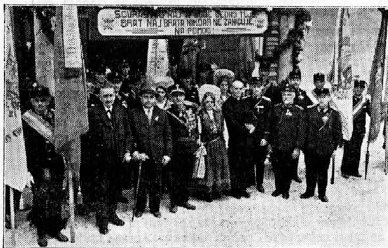
Proslava 45 letnice gasilske čete v Dovju

Popolno priznanje zasluži naša gasilska četa Stranska vas - Krupa, ki je, dasi razkropljena po polju in raznih opravkih, z neverjetno naglico v 10 minutah stopila v akcijo s svojo novo motorno brizgalno, ki jo je pred kratkim prejela od