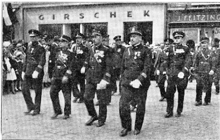
Jugoslovanska delegacija v obhodu po Opavi dne 20. maja

edinic ter jim utirali pot k ustvaritvi velike vseslovanske gasilske organizacije na naši evropski celini.