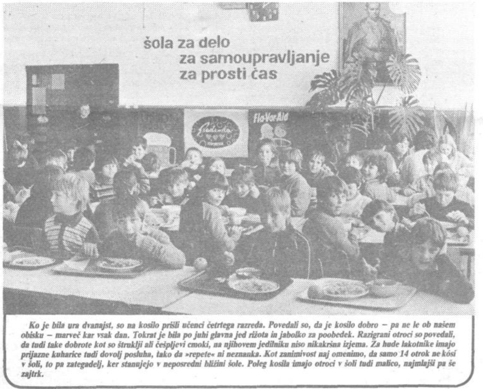
Ko je bila ura dvanajst, so na kosilo prišli učenci četrtega razreda. Povedali so, da je kosilo dobro – pa ne le ob našem obisku – marveč kar vsak dan. Tokrat je bila po juhi glavna jed rižota in jabolko za poobedeč. Razigrani otroci so povedali, da tudi take dobrote kot so štruklji ali češpljevi cmoki, na njihovem jedilniku niso nikakršna izjema. Za hude lakotnike imajo prijazne kuharice tudi dovolj posluha, tako da »repete« ni neznanca. Kot zanimivost naj omenimo, da samo 14 otrok ne kosi v šoli, to pa zategadelj, ker stanujejo v neposredni bližini šole. Poleg kosila imajo otroci v šoli tudi malico, najmlajši pa še zajtrk.