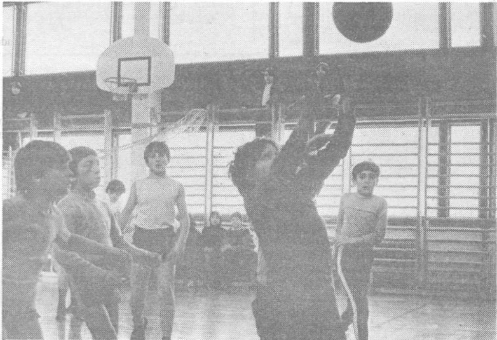
Med uro telesne vzgoje je bilo živahno, morda zato, ker pred fotoaparatom košarkarska žoga kar ni in ni hotela skozi obroč. Sicer pa je košarka le eno od veselih dobroviških otrok. V njihovi šoli se med šolskim letom zvrsti skoraj 50 različnih krožkov, tako da se prav vsakdo lahko vključi v dejavnost, ki ga najbolj pritegne. Letos so kupili tudi dva ZX spectruma in že kar precej otrok se je spoznalo z osnovami programiranja oziroma s programskim jezikom basicom. Omeniti velja tudi prvi podvig zgodovinskega krožka, ki je – verjetno ali ne – izdal celó knjigo z naslovom »Moj kraj med NOB«, za kar so učenci prejeli nagrado viške raziskovalne skupnosti. Razvejanost vseh dejavnosti je zares izredna.