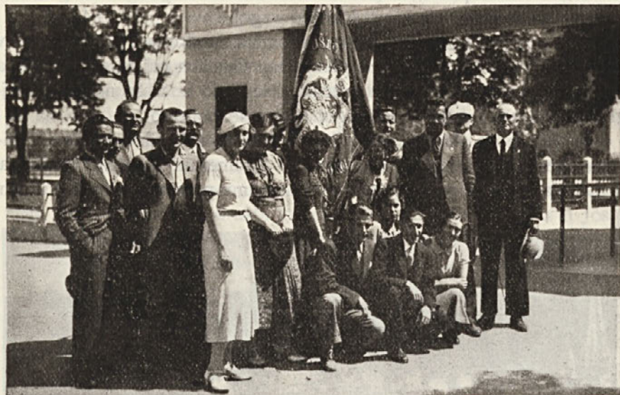
Odposlanstvo Sokolskega društva Sisak

teh skupnih nastopov posvetiti v bodoče vso skrb in pažnjo, da bo ogromen trud za priprave dal zadovoljiv rezultat tudi v finančnem oziru — vsaj dokler so društva navezana na te vrste dohodkov. O potrebi in uspehu nastopa samega poročča obširno brat načelnik.