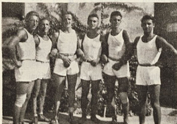
Savezni prvak S. K. J. v igri odbojki v l. 1935.

Brati Čehi — sveži in spočiti, so zmagali z rezultatom 15 : 5 in 15 : 7. V tretjem kolu, ki je bilo sicer prekinjeno radi teme, so naši bratje nudili bratom Čehom hud odpor; igra je končala z rezultatom 5 : 6 v korist bratov Čehov. Končni uspeh tekem za slovansko prvenstvo v igri odbojki je bil nastopni: I. mesto ČOS, II. mesto SSKJ in III. mesto Savez Bolgarskih Junakov.