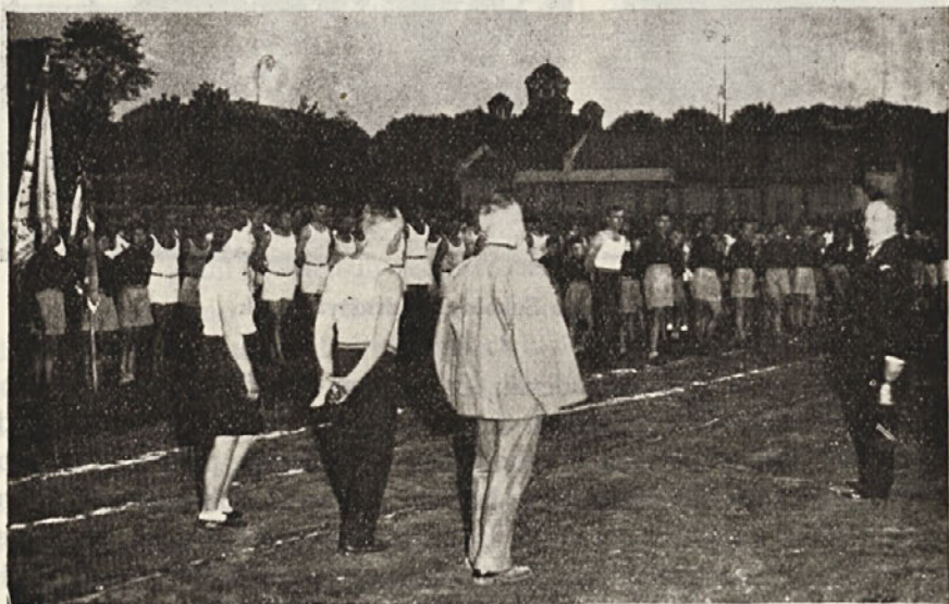
Ob otvoritvi letnega telovadišča

Če bo dal ta skupni nastop novih pobud in svežih moči za uresničenje plemenitih teženj in stremljenj v posameznih društvih, ki so napravila ta poizkus, potem je trud poplačan in v polni meri dosežen uspeh.