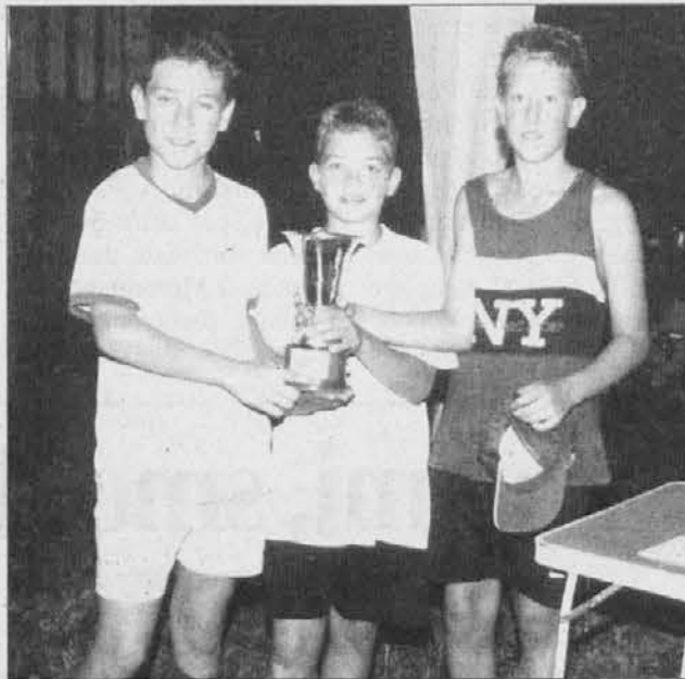
I degni antagonisti di Sorzento