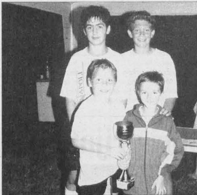
La squadra di Ponteacco vincitrice del torneo

A causa della imminente oscurità, la finalina non si è