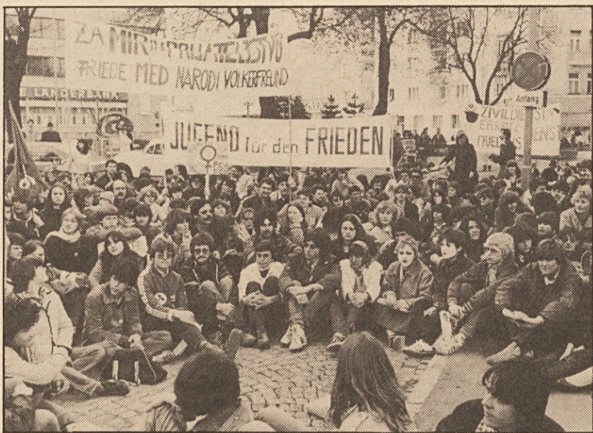
Pri mirovnem pohodu v Celovcu so med drugimi mladinskimi organizacijami sodelovali tudi Slovenci. Koroška dijaška zveza, Katoliška mladina ter Zveza slovenske mladine.