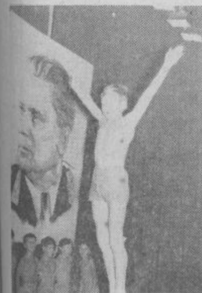
V Šoštanju in Smartnem ob Paki so imeli za dan republike akademijo, ki jo je organizirala obč. zveza za telesno kulturo.