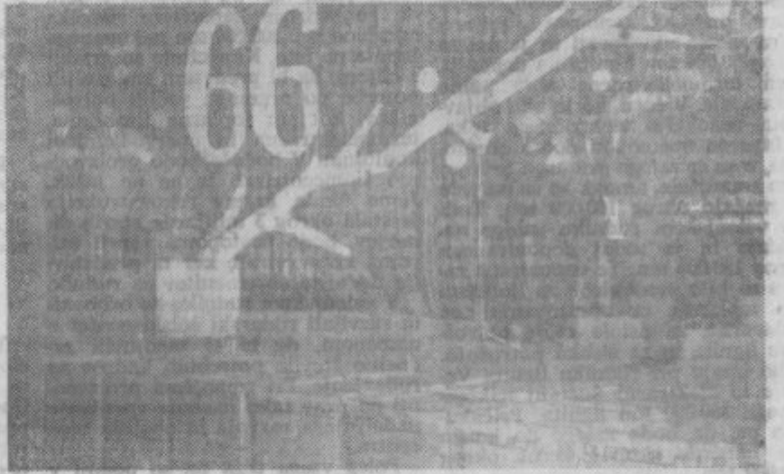
Moški pevski zbor iz Velenja in drugi nastopajoči, na svečanem zboru v »Gorenju«.

le povabljenca v sejno sobo na informativni sestanek. Ko so jih podrobneje seznanili z njihovimi nadaljnjimi načrti, je spregovoril di-