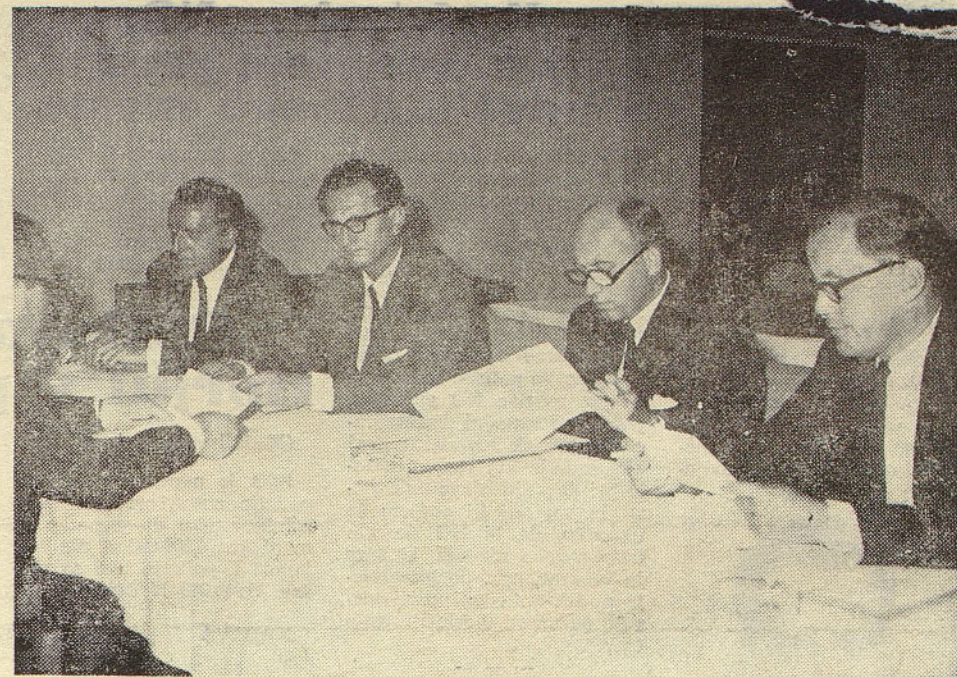
Predstavniki koncerna ITT in ZP ISKRA med podpisom pogodbe