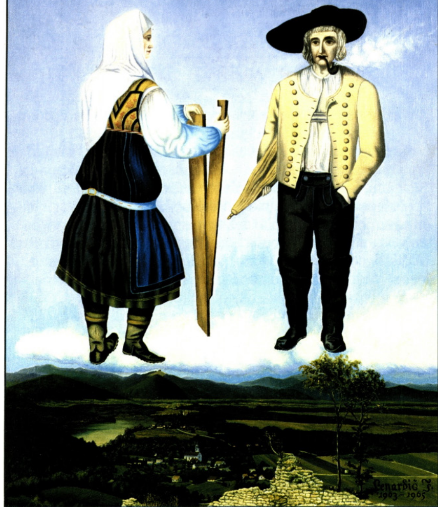
Narodna noša okoli Smlednika

Narodna noša okoli Smlednika Landstracht aus der Gegend von Smlednik { Slovenien — Jugoslawien } Costume national des environs de Smlednik { Slovenie — Yougoslavie }