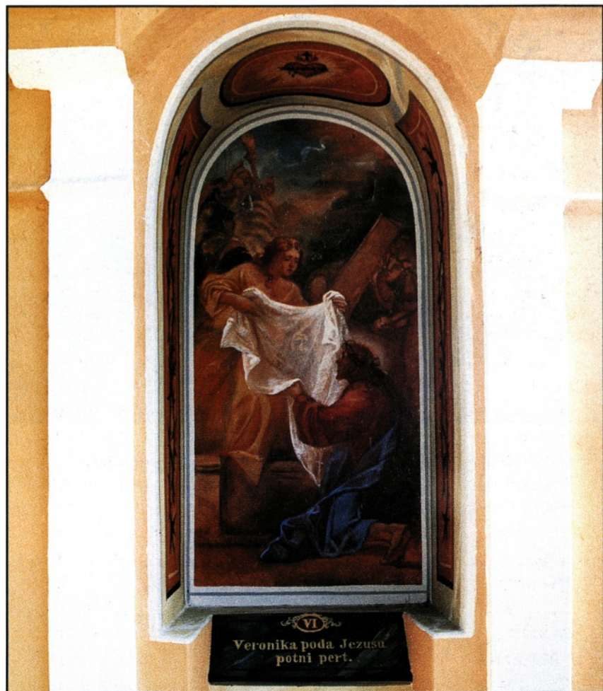
VI Veronika poda Jezusu potni pert.

Ko se spustimo iz Starega gradu po cesti navzdol do vznožja hriba, opazimo Kalvarijo, križev pot s štirinajstim kapelicami in tremi križi na vrhu. Sezidana je bila leta 1772, dokončno obnovljena leta 2001, in smo jo, zaradi njene posebnosti in lepote, podrobneje opisali v posebnem članku v tej publikaciji.