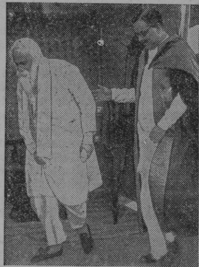
Rabindranath Tagore, slavni 76letni indijski pesnik, je imel na vseučilišču v Kalkutti v Indiji predavanje.