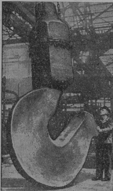
7 ton težki kavelj za žerjava je vilo nemško podjetje Krupp.