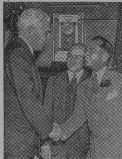
Rooseveltov naslednik kot predsednik Združenih ameriških držav bi naj postal Paul Mc Nutt, deželni glavar države Indiana in novi nadkomisar Filipinskega otočja v Tihem Oceanu.