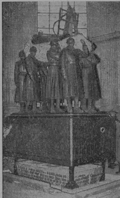
Krsto rajnega francoskega maršala Focha bodo prepeljali v Invalidni dom v Parizu in jo položili poleg ostankov Napoleona. Po prevozu bo dobil maršal spomenik, katerega vidimo tu na sliki.