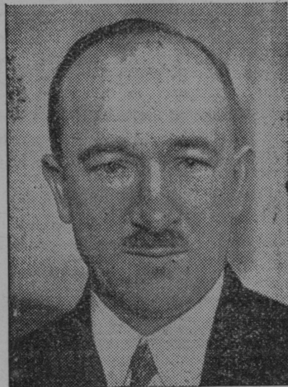
Predsednik Čehoslovaške dr. Beneš bo obiskal Belgrad.