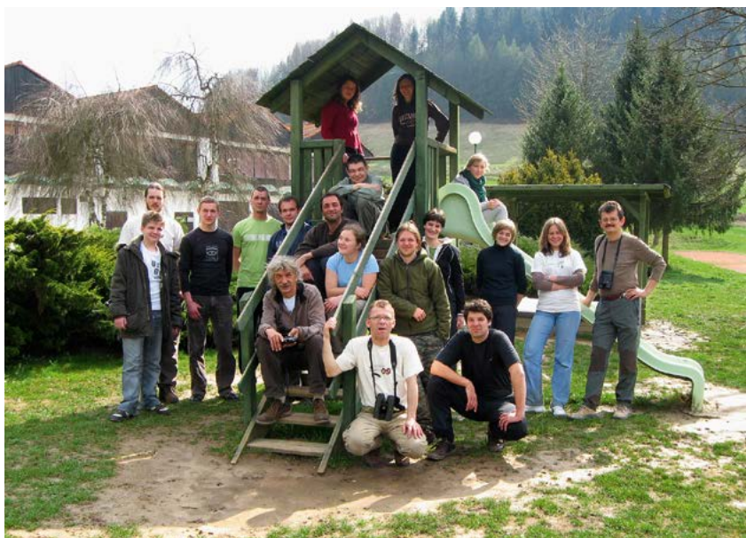
Skupinski popis za Atlas ptic Slovenije leta 2009 v Mokronogu