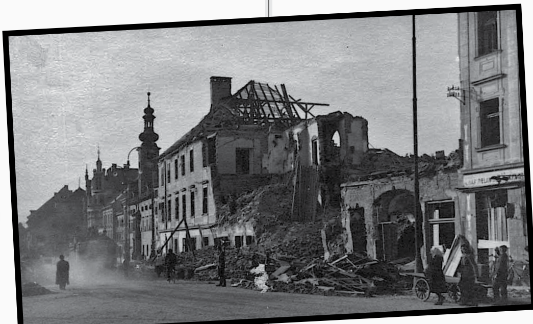
Glavni trg po bombnem napadu 14. oktobra 1944.