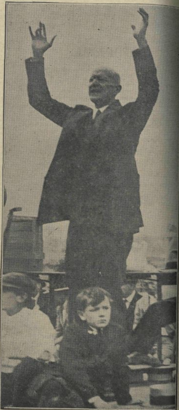
E. V. DEBS

Na odru se vrste govorniki, močni borci, ki širijo luč resnice in organizirajo armado delavstva za borbo, ki bo odrešila človeštvo. Vsi so izkušeni, vsi razumejo težkoče s kate-