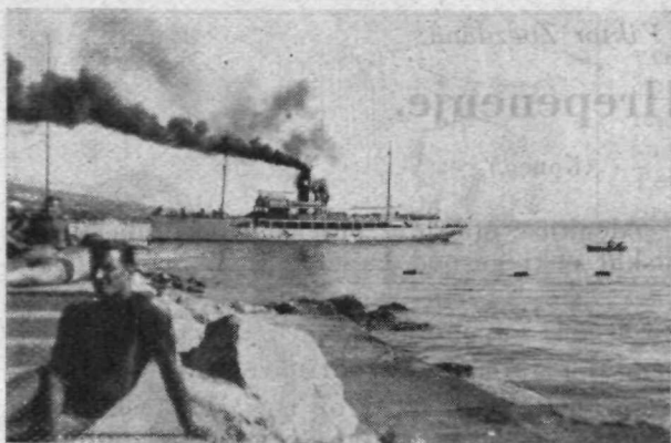
Potniška ladja odhaja ...

Poslovala sva se. Zdenka me je pridržala za roko: »Gospod Matko, kaj pravite, ali so vsi pomorščaki tako dobrosrčni, kot je gospod kapetan? Poglejte, vprašal me je celó za naslov naše gospodične šolske upraviteljice. Za Božič namerava poslati darove, da bi se obdarovali najrevnejši učenci in učenke naše šole.« Odšel sem.