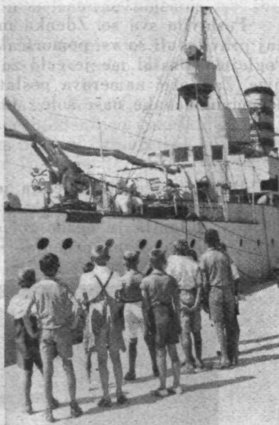
Mladina občuduje minosca.

Tudi na trgovskih in potniških ladjah so častniki, podčastniki in moštvo. Častniki so poveljnik, plovilbeni častnik in strojniški častniki. V častniškem zboru so tudi ladijski zdravnik in radio-brzojavec. Na velikih potniških ladjah biva tudi do 20 strojniških častnikov. Kotli za proizvodnjo pare se kurijo s premogom ali nafto. Služba na morju zahteva od pomorščakov dostikrat težkih žrtev in naporov. Zato so pomorščaki zdravi in močni ljudje. Življenje na morju ne pozna slabičev. Tu mora vsakdo vestno opravljati poverjeno mu dolžnost. V rokah pomorščaka je usoda vse ladje, moštva in potnikov. Samo majhna nepazljivost — in lahko se ladja potopi v neizmerne morske globine.