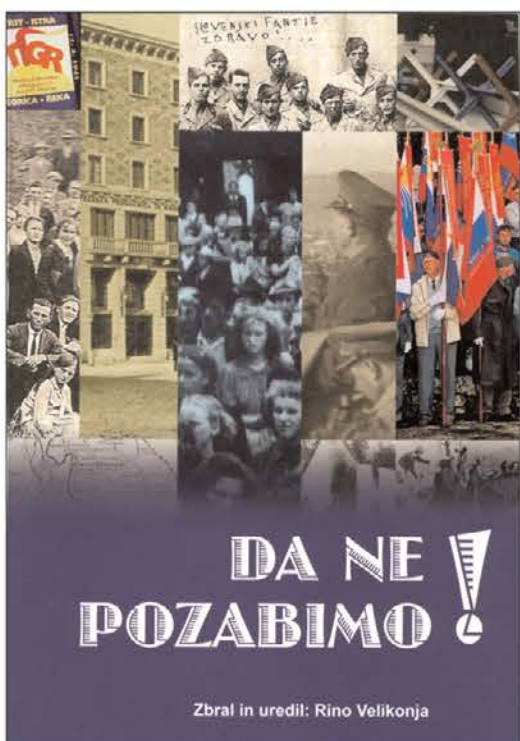
Zbral in uredil: Rino Velikonja

verno Primorsko. Avtor je zapisal, "da vodnik zajema dogodke dvajsetega stoletja na Goriškem, ki je doživljalo zgodovino tistega časa