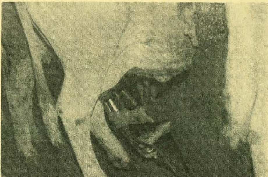
Boljše je kot včasih, ko so bolele roke