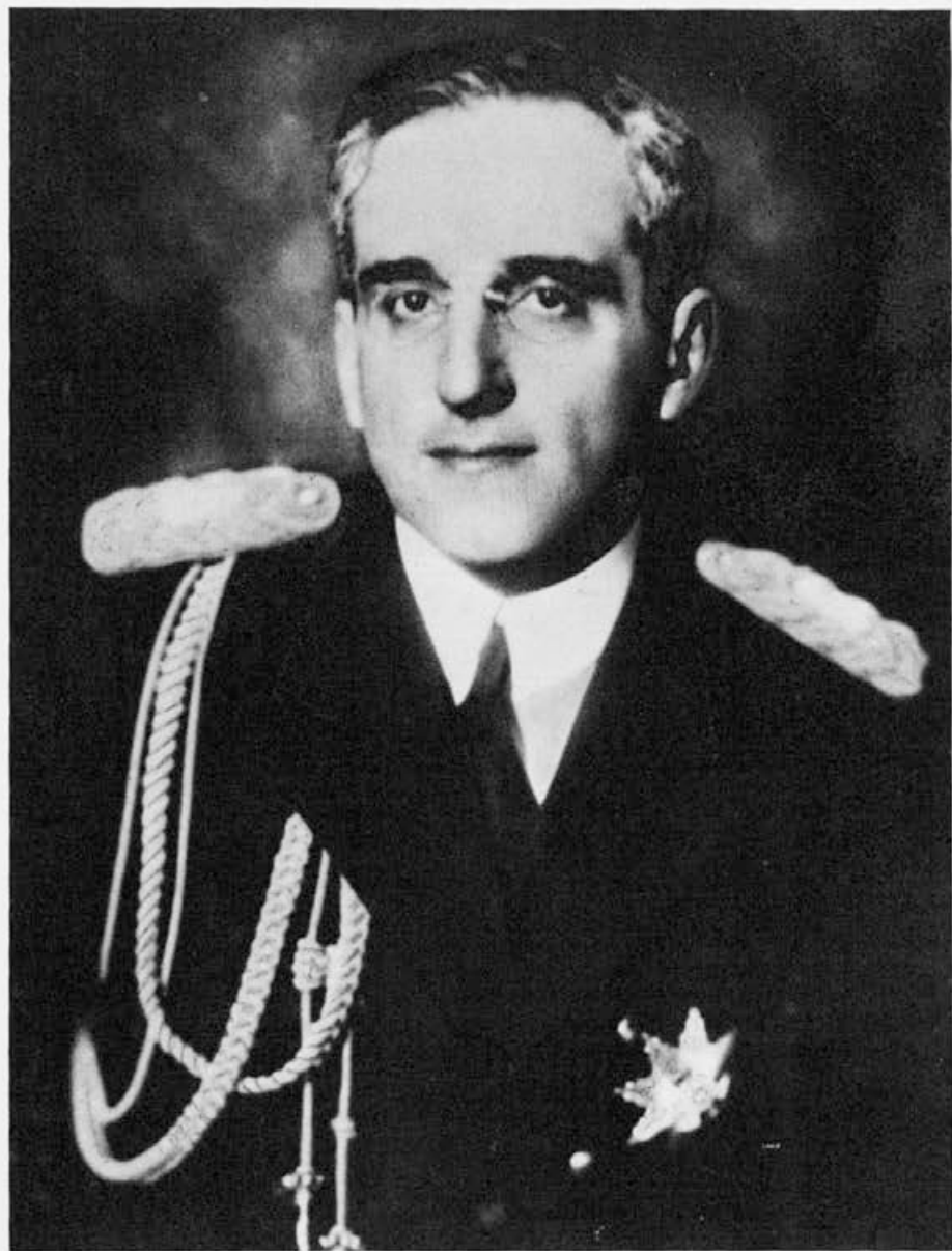
† Viteški kralj Aleksander I. Zedinitelj