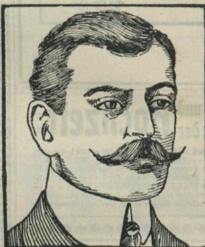
Nach dem Gebrauch.

die beste Gehirn- und Nervenmahrung der Natur.