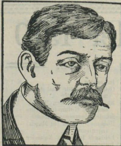
Vor dem Gebrauch.

mit 5 Zimmern oder 3 Zimmern und 2 Kabinetten, ausgestattet mit allem Komfort zu beziehen im Maiertermin . Zuschriften an die Administration dieser Zeitung unter „ Ruhige Partei “. (10) 3-3