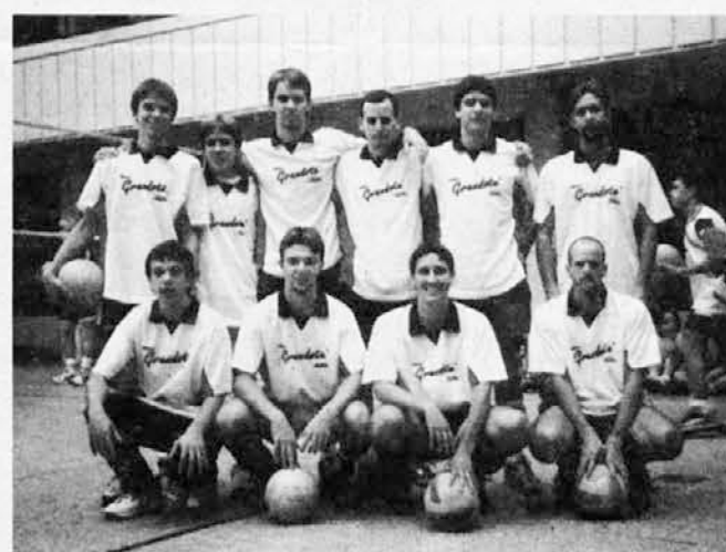
PRISTAVA - SFZ

Ko smo že omenili carapachajsko dekliško ekipo zapišimo, da nas vedno presenečajo. Kljub porazom ne omagajo. Poleg San Justa so igrala še proti Ramosu. In čeprav so tudi to igro izgubile (2:0 - 26:24 / 25:20), se niso