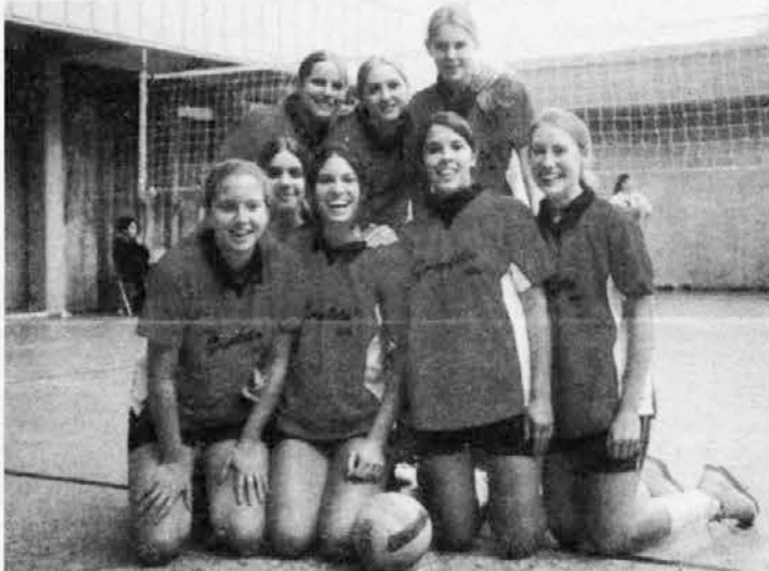
PRISTAVA - SDO

(Ali zbiraš besede, ki jih objavimo v vsaki številki?) napet = tenso; prepričljiv = convincente; podati se = rendirse; so se obrnile = se dieron vuelta; živci = nervios; zmožen = capaz; obnoviti = renovar; upanje = esperanza.