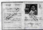
1948 República Italiana