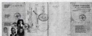
1948 Comité Internacional de la Cruz Roja