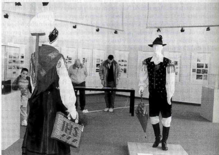
Pogled v razstavni prostor

Priprave na razstavo so sledile naslednjim temeljnim vsebinskim izhodiščem: 1. Prikazati priseljevanje Slovencev na argentinska tla od 80-ih let 19. stoletja (začetki množičnega priseljevanja) do 50-ih let 20. stoletja (zaključek množičnega priseljevanja).