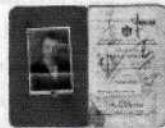
1928 Reino de los Serbios, Croatas y Eslovenos