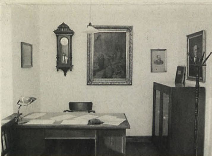
Notranjščina nedeljske hranilnice