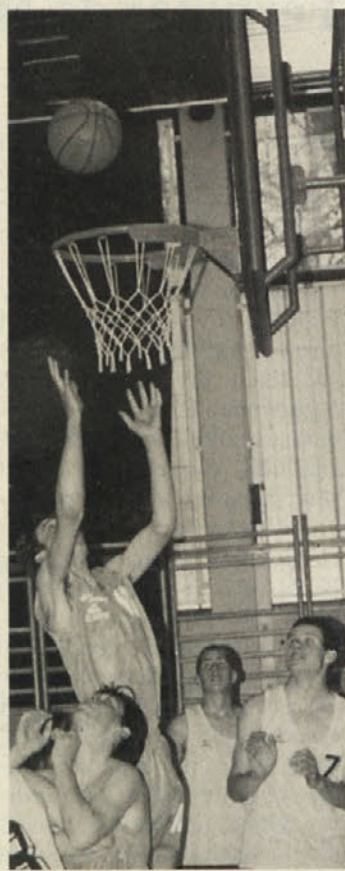
Igralci KOŠa so bili v super formi