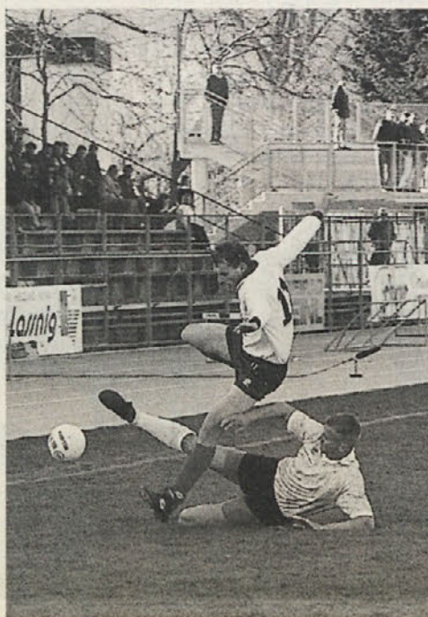
VSV je igral zelo trdo