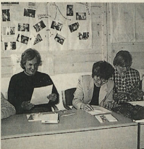
Učence so motivirali besedni ustvarjalci in učitelji

pisanje učencev. Sledil je pogovor s pesnikom, otroci iz Slovenije pa so brali pesmi in besedila, ki so nastala v njihovih literarnih kroških. Izkazali so se kot pravi besedni mojstri.