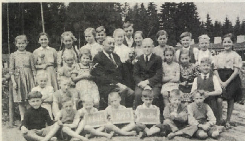
Otroci v taboriščni šoli na Hesselbergu

Koliko bridkih usod, koliko izgubljenih let, koliko neizbrisnih spominov, katera jim še danes usmerjajo življenje!