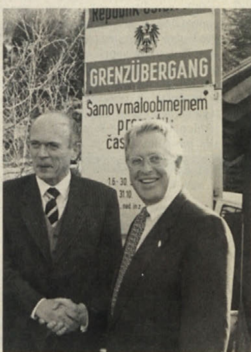
Premier Drnovšek in deželni glavar Zernatto na državni meji.

Koroška delegacija je razgovore načeloma ocenila pozitivno, ker da so potekali v odpr-