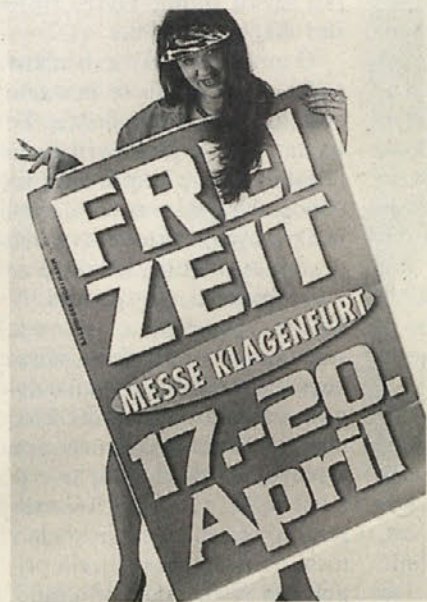
Sejem »Prosti čas« nudi za vsakega nekaj

Turistično gospodarstvo, ki je na Koroškem sicer že nekaj let v krizi, je edina panoga, ki je v nenehnem porastu. Skoraj