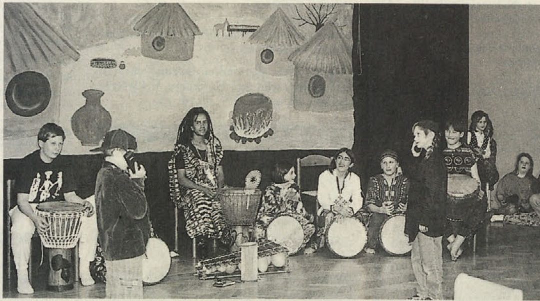
Otroci varstva ABCČ in Mladinskega doma so radi sodelovali v predstavitvi Afrike

Vsem, ki so prispevali svoj del k uspehu tega projekta, iskrene čestitke.