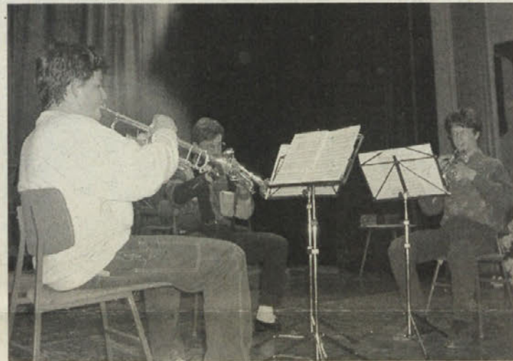
Odlični trio trobent z Radiš

zamejskih glasbenih šol v Italiji in Avstriji. Srečanje je vsako leto v drugem kraju Gorenjske in je najstarejše tovrstno srečanje glasbenih šol v slovenskem kulturnem prostoru.