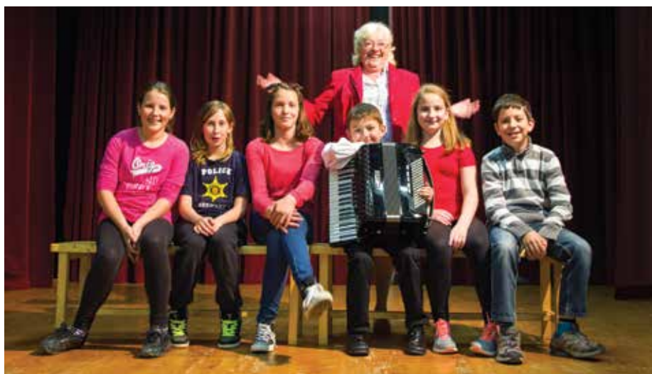
Prgarke so skrbele tudi za podmladek.