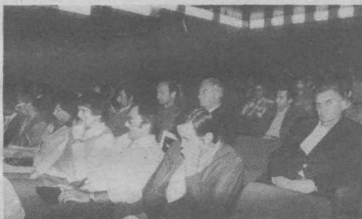
Udeleženci enodnevnega posveta sindikalnih aktivistov.