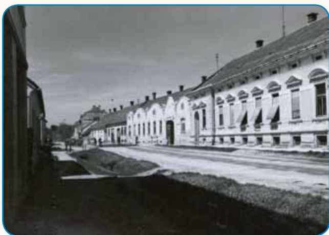
»Okauli šinjeka je furt meu zvezani vacalejk« stran 45