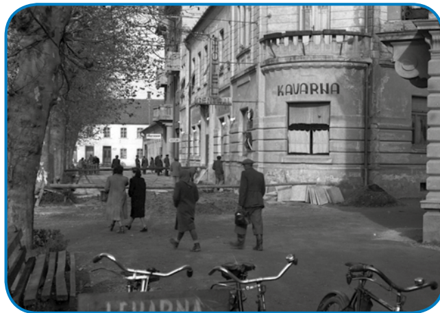
Glavna soboška, gnesden Slovenska vilica