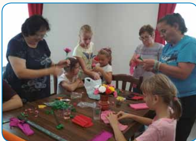
Medgeneracijsko druženje v Markovci stran 7