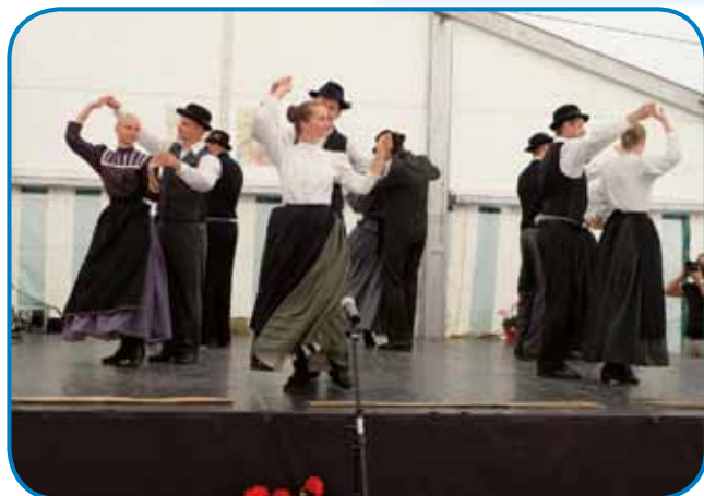
V programi je zaplesala sakalovska folklorja tö.