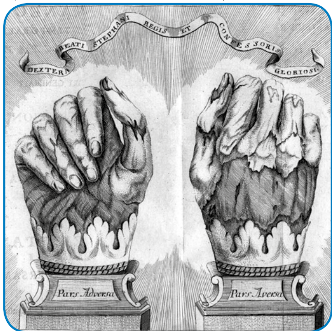
Svetoga Števana prava rauka na ednom lesorezi s cajtov Marije Terezije

žarske - leta 1945 pa je bila znamenje nauvoga začetka v ednom rosagi, šteri je biu na nikoj djani po ednoj zgüblenoj bojni.