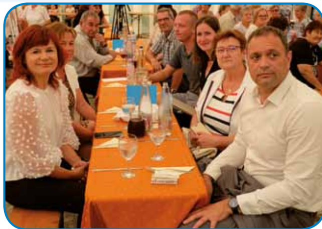
Med gledalci tudi visoki gostje

Na prireditiv so bila pozvana vsa prijateljska slovenska drüštva s te in drüge strani nekdešnje meje, s