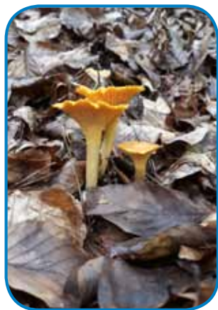
Velko veselje je najti lejpe lisičice

Letos dostakrat pride velki dež, zemlja se je že nutnamaučila. Tau je rejsan radost za pavre, dapa za tiste tō, steri radi ojdimo v les gobe brat. Ne smejmo se taužiti, dosta gob rasté za gesti, dapa taše tō, stere so strupene, zaman so lejpe (rdeča mušnica/légyölő galóca, zelena mušnica/gyilkos galóca, oljkov livkar/világító tölcsérgomba).