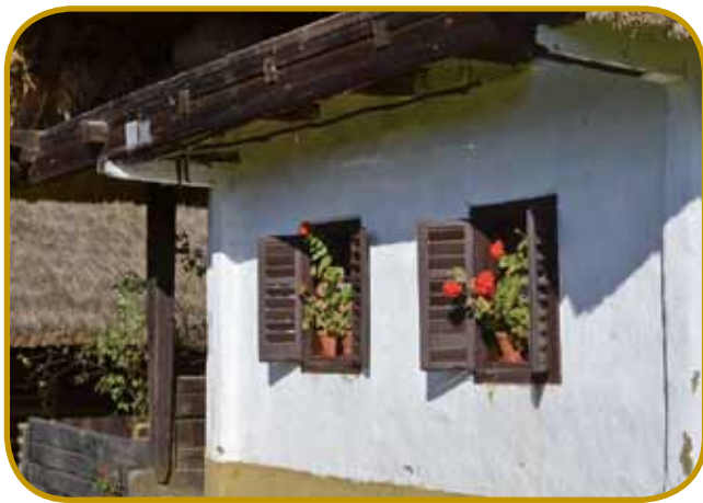
Tipična cimprana iža v krajini Órség - nekda bi leko bila v Porabji tó

Porabji) vseposedik rasla gaušča, štero je trbólo trejbiti s krčavkov. Lüstvo je svoje kuče v menjši krošlaj (szerek) zidalo, največ z domanjoga lesa.