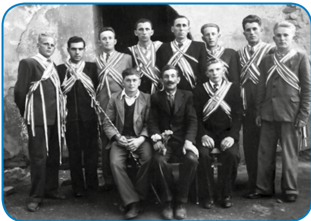
Regarutke v Slovenski vesi po bojni (leta 1946 ali 47)

tašo tö, ka sem prejšnji večer cejli saloncutjar zezla, zato ka tak fejst sem zandareča bila. Baba drügo nej vejdlja, iz repe