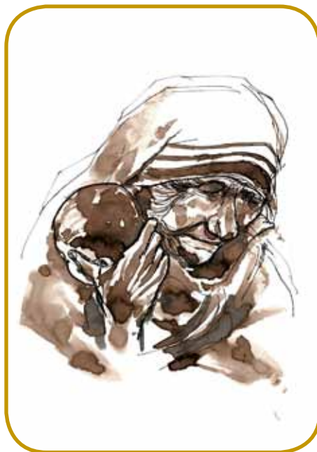
»Vi ste živa svetnica,« je nekak pravo Materi Trejzi, štera je dala valas: »Samo tau sem, ka bi po Gospaudovoj vauli mogli biti vsi.«

oča pa je biu gospodar dvej varašov. Rozalijo so gorranili kak kralično, gda pa so najšli mladoženca za njau, je vüjšla v samočo. Skrila se