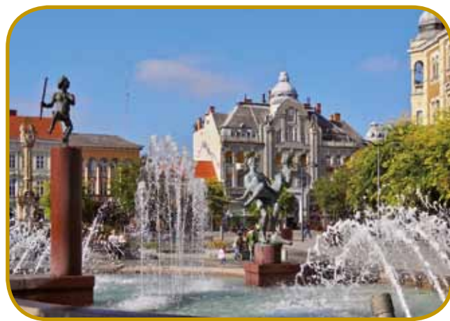
Glavni trg Sombotela - lüstvo rado vküppride pri vodometi

Na srejdi Glavnoga trga je nekda stau varaški törem, gnes se tam zdigava znamenje sveto-