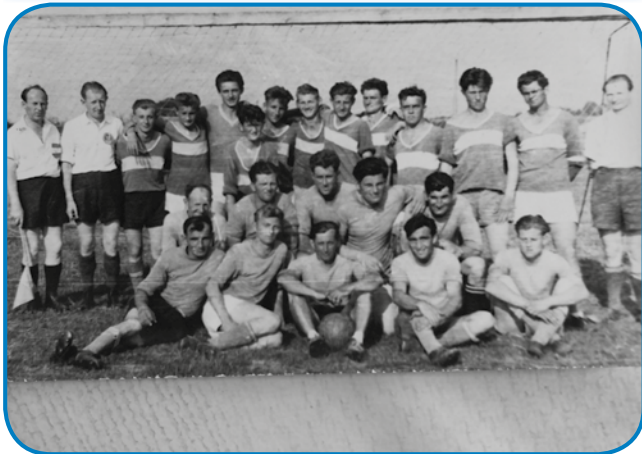
V Slovenski vesi so vsigdar radi meli nogomet

stari bili. Gnauk si je nika zmislila, na šift vsela pa se je za njim v Meriko odpelala. Trinajset lejt