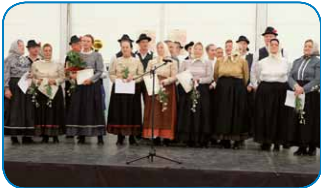
Vsi nastopajoči na odri