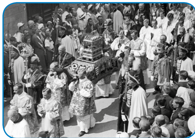
Procesija Svete desnice pred drugov svetovnov bojnov

Legenda püşpeka Hartvika z 12. stoletja pravi, ka gda so Števana grob leta 1083 oprli, »je od tistec slatko denélo, vsakši je brodo, ka je prišo v Boži Paradičom. Škri-