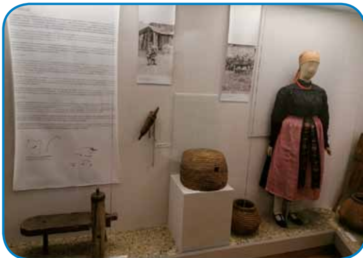
Skromen delež Slovencev v mohaškem muzeju