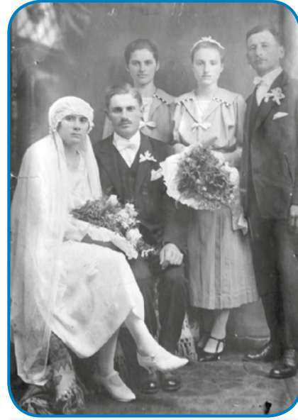
Zdavanjski kejp njene babe iz leta 1926. Gvant so si vejnrik iz Merike prinesli

vsigdar spoj rada mejla, zato ka tak dobro so vedli pripovejdati. Mam eden taši kejp tö, gda sem z njimi dolavzeta, gda je prvo