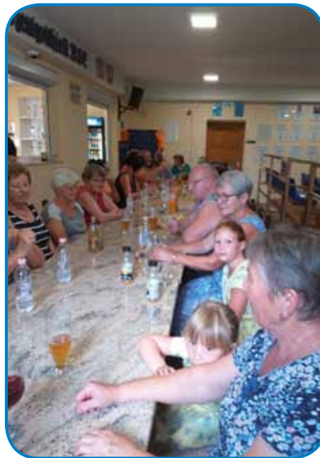
Med tejm ka so se eni kejljali, so se drugi pogučavali

nam nej posrečilo vküp pridti. Nika ne deje, mi ne odvüpa-mo! Nauvomi predsedstvi predlagam, aj dočas štımajo