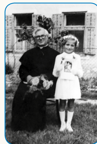
Čozi, gol, gol! stran 8