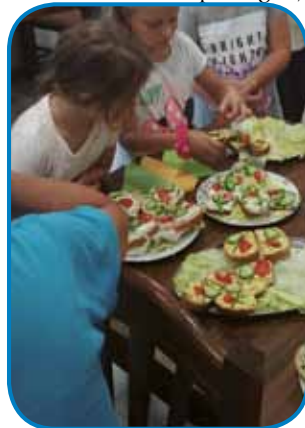
Gastronomska pa ...