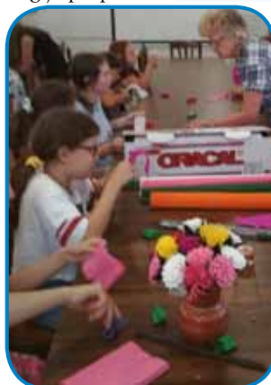
... rokodelska delavnica

Skrbeli so se za nas, güžino pa dober obed smo dobili, trno prijazni so bili z nami.