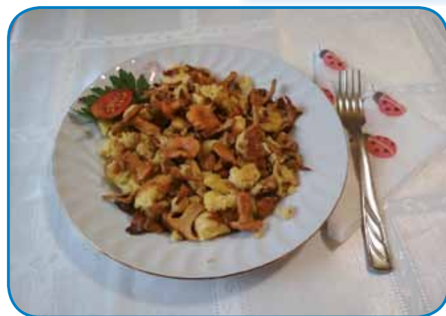
Šmarni z lisičicami

od daleč vidimo, ka se svejti-jo kak zlato. Dosta lidi zato ma lisičice raj