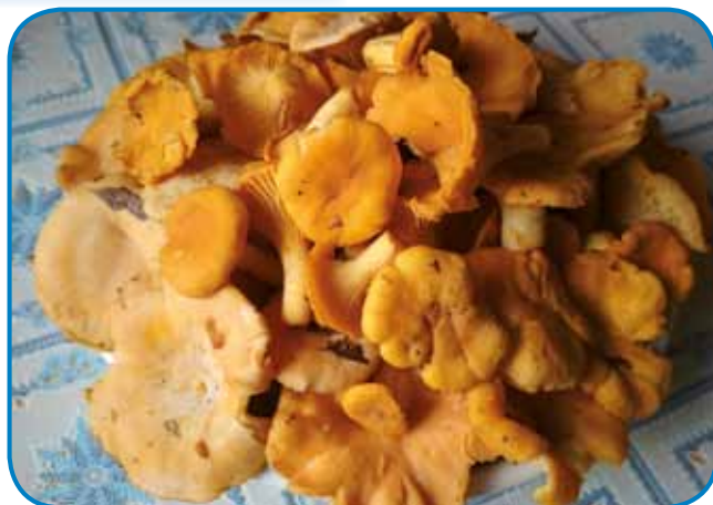
Iz ednoga takšoga kupa se že leko sküje pörkölt ali paprikaš

ši spoznali gobe, vedli smo, stere so za gesti, etak se je nej zgodilo, ka bi nekak zatok mrau, ka je »naure« gobe djo. Naši starci so vsigdar gučali, ka kak mejsac rasté, tak grbanji pa lisičice tō rastéjo. Tau je istina, zatok je najbolje vrejndno gobe iskati, gda je puna luna. Za grbanji so najbavkše pa največ vrejndne lisičice. Te lejpe žute gobe rastejo od juniuša do kesne geseni. Fanj ji je brati, ka ji že