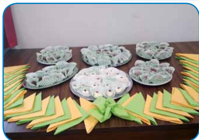
Končni izdelki gastronomske delavnice

V torek smo mi, porabski penzionisti tó »pofarbali« njini den z zdravim gestijom pa raužami vsej farb. Vüpamo, ka