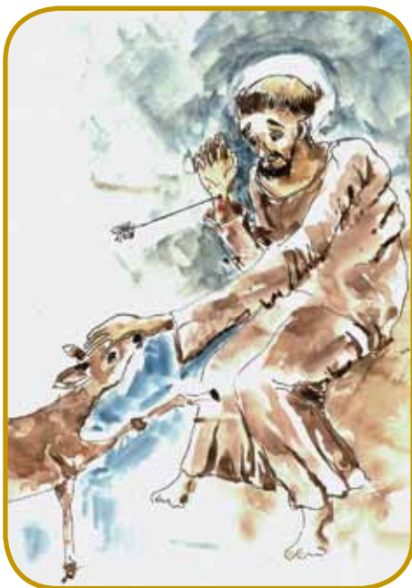
Sveti Egidij je s svojim tejlom rejšo srno, štera ga je v lesej nadajala

kva. Priporočali so se ma za dober pauv ino srečo z marov, za lejpo vrejmen, prauti odnji, straji ino kügi. Molile so ga ženske, štere