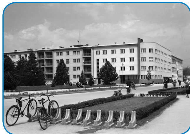
Pogled na nekdešnji Delavski dom, gnesden je tü sedež soboške občine

Po tistom, gda so ga začnile zanimati tudi nauve reči, sta se leta 1958 z ženo preselila na drugi konec Slovenije, v Koper. V Soboti je tistoga cajta nej bilau dosta fabrik, Kološo pa je začni-