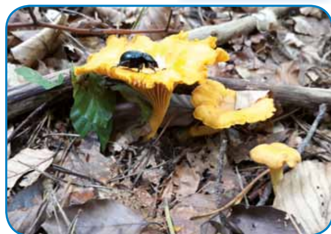
Lisičice so nej črvive pa požacke je tō ne zgrzejo

ši spoznali gobe, vedli smo, stere so za gesti, etak se je nej zgodilo, ka bi nekak zatok mrau, ka je »naure« gobe djo. Naši starci so vsigdar gučali, ka kak mejsac rasté, tak grbanji pa lisičice tō rastéjo. Tau je istina, zatok je najbolje vrejndno gobe iskati, gda je puna luna. Za grbanji so najbavkše pa največ vrejndne lisičice. Te lejpe žute gobe rastejo od juniuša do kesne geseni. Fanj ji je brati, ka ji že