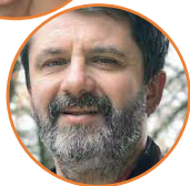
PODPREDSEDNIK: Rudi Tavčar