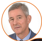
PRESEDNIK: Aleš Butala