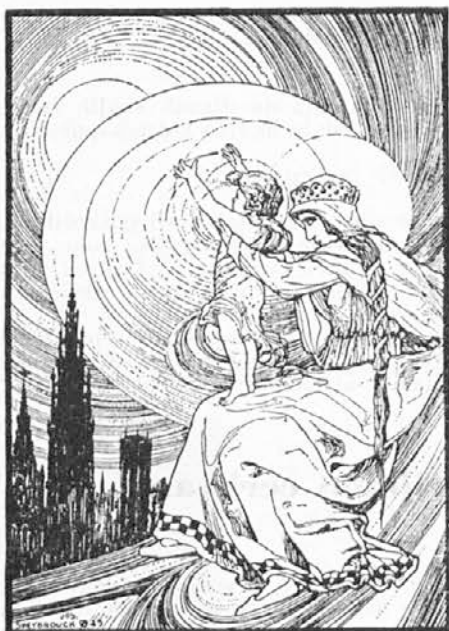
Marija z Detetom

ljudstvo vselej in povsod odgovorno, kar delajo med njim in pred njim in z njim njegovi nepoklicani zastopniki.