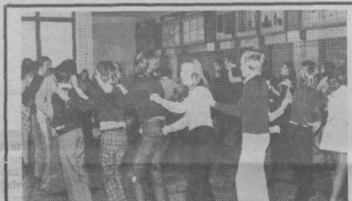
V oktobru 1973 so pričeli na osnovni šoli Ketteja in Murna tudi s plesnimi vajami in sicer pod vodstvom plesnega učitelja Oblaka. Učenci so se naučili vrsto plesov, ki jih kot kaže posnetek že kar dobro obvladajo

večji poudarek na delu v korist vaščanov Zaloga, Sp. Kašlja in Podgrada.