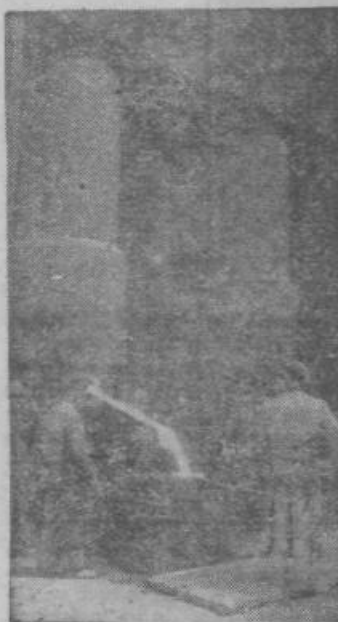
Livarna v tovarni »Djuro Djakoviča«

Danes vzdržuje Jugoslavija redne trgovinske odnose s 79 državami, medtem ko je imela l. 1952 trgovinske odnose le s 59 državami.