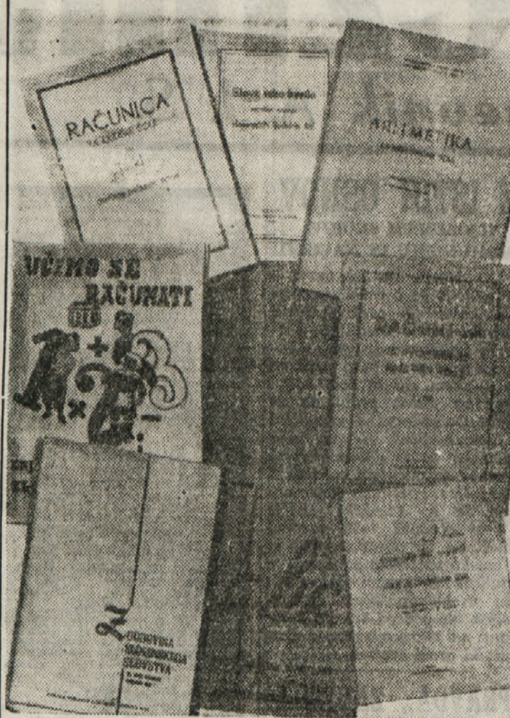
Skupina knjig, ki jih je izdala Zavezniška vojska uprava za slovenske osnovne in srednje šole.