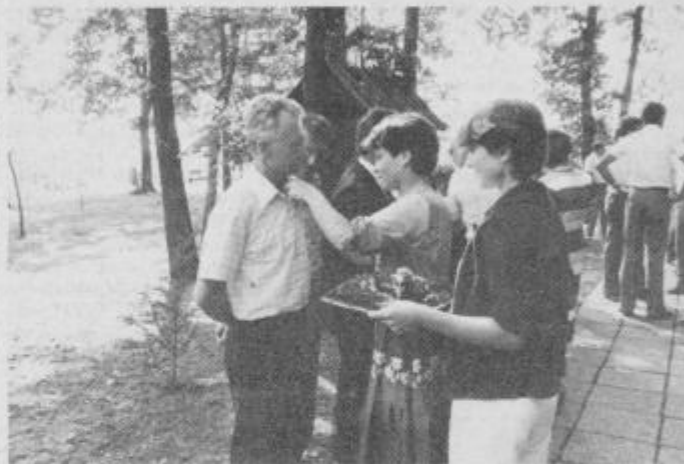
... dekleta pa so jim pripela nageljne. Sprejem je bil pred domom LD Kidričevo