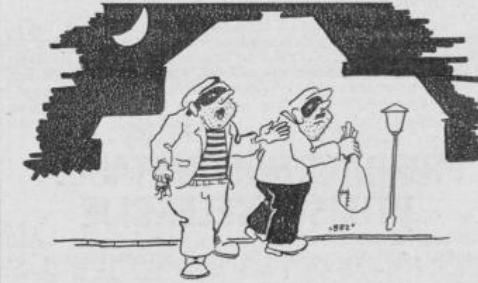
Ali je to pravica, medtem ko ljudje uživajo svoj dopust v brezdelju, imava midva največ dela.

MOŠKI: Nekje vas čaka darilo. Z imenitno žensko se boste srečali. S svojim duhovičjem boste želi uspeh.