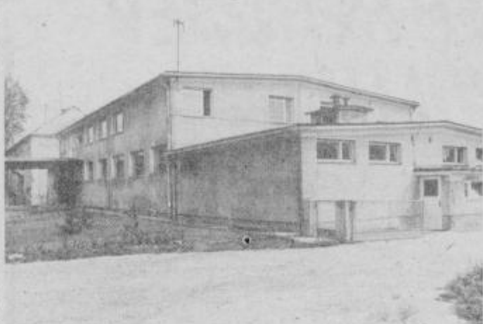
Ze zunanost opozarja, da je obrat star.

najboljši izdelek. Seznanili pa smo se že, zakaj temu vedno ni tako. Kljub vsemu pa naš odnos do kruha ni najboljši, še vedno ga ne znamo ceniti. Najdemo ga povsod na smetišču, v kanti za smet ostaja doma, ker ni več svež.