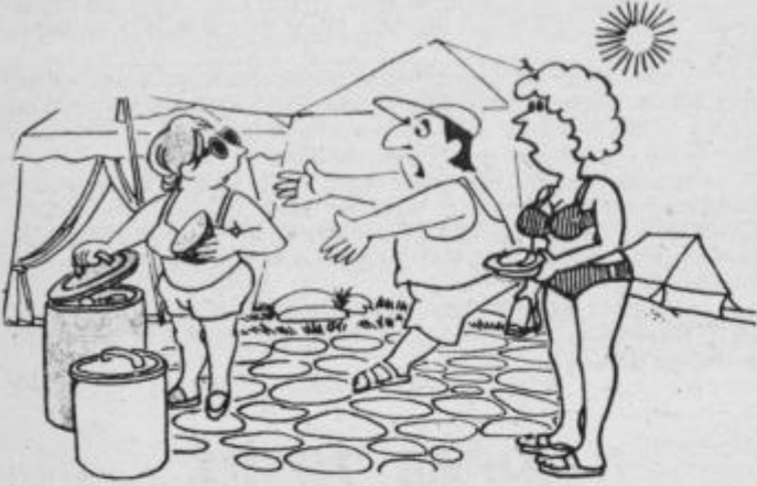
Si neumna, da mečeš kruh v stran, a ne veš za koliko se je podražil??