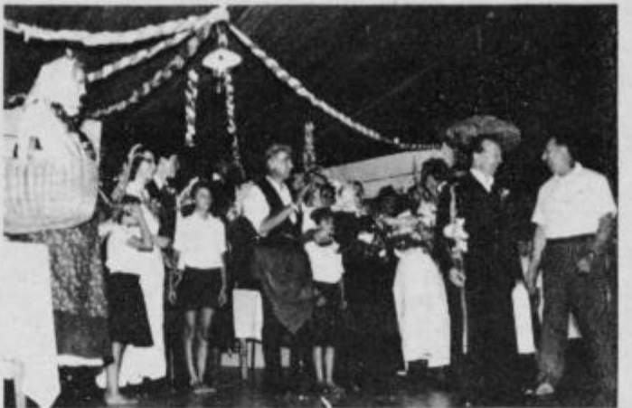
Občinstvo je gibu in besedi sledilo z vso pozornostjo in večkrat nagradilo igralce z aplavzom na odprti sceni.

Reči je treba, da je skupina precej odstopala od povprečja siceršnjih ljubiteljskih skupin, ki jih je moč videti na občinskem srečanju gledaliških