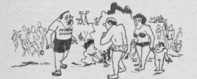
— A, vi pa smeti kar v grmovje?! — Ja, kaj pa mislite, saj vendar ne bom odpadkov nosil domov mimo čez vrh nabasanih in na redko posejanih košev za odpadke...