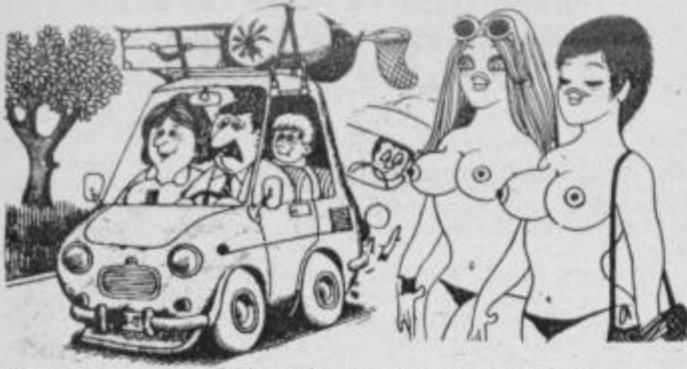
Ko se vrnemo z dopusta pa se moramo res pošteno odpočiti...