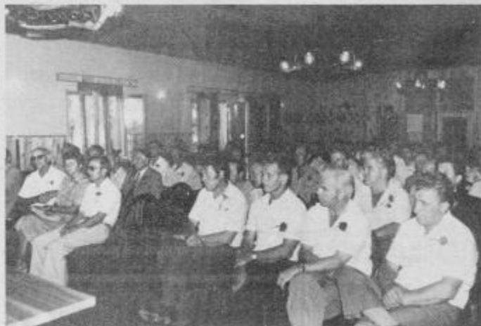
S skupne seje vodstev pobratenih krajevnih skupnosti, ki so se je udeležili tudi številni gostje