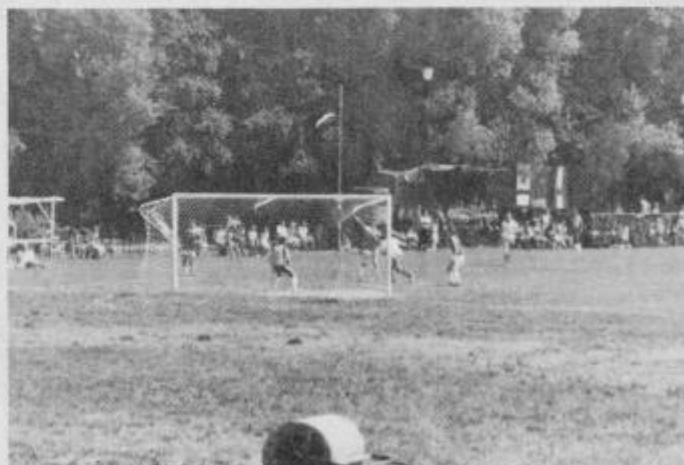
Medtem ko je v domu potekala svečana seja, so na igrišču potekala nogometna srečanja v počastitev 35-letnice aktiva TVD Partizan