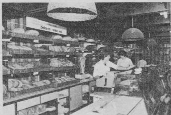
Nova prodajalna je dobro založena...

Svoje bo o prodaji kruha, povedal še Konrad Vrbnjak, poslovodja nove prodajalne: „Prodaja raznih vrst kruha, slašičarskega in