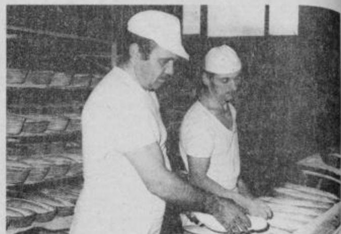
Kruh nastaja v težkih delovnih pogojih, veliko je še ročnega dela.

Želimo si več posluha od širše družbene skupnosti. Vemo, da je problemov vedno več, zavedamo