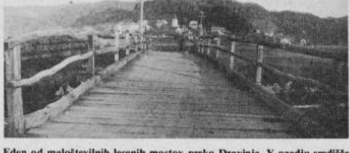
Eden od maloštevilnih lesenih mostov preko Dravinje. V ozadju središče KS Makole.

Ze konec tega meseca kolektiv Planina-Statenberg organizira Štatenbergško noč, na kateri se bodo predstavile folklorne skupine. Osrednji del prireditve pa bo srečanje in skupni nastop najstarejših harmonikarjev iz severovzhodne Slovenije. Nastopili bodo tudi zabavni ansambli s znanimi pevci. Na prireditvi bodo pripravili tudi modno revijo in izbrali najlepše dekle štatenbergške noči. V jesenskem času pa načrtujejo še gostovanje mariborskega gledališča z Gorenjskim slavčkom. Skupno s kmetovalci iz KS Makole in Studenice pa načrtujejo organizirati še ličkanje koruze in kmečke igre.