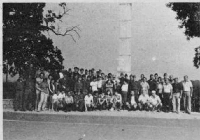
Udeleženci udarniškega dneva v počastitev 8. avgusta — praznika občine Ptuj ob spomeniku padlim borcem Slovenskogoriške-Lackove čete v Mostju

Pred prihodom na delovišče so udeleženci udarnega dne pred spomenikom v Mostju z enominutnim molkom počastili spomin padlih borcev in