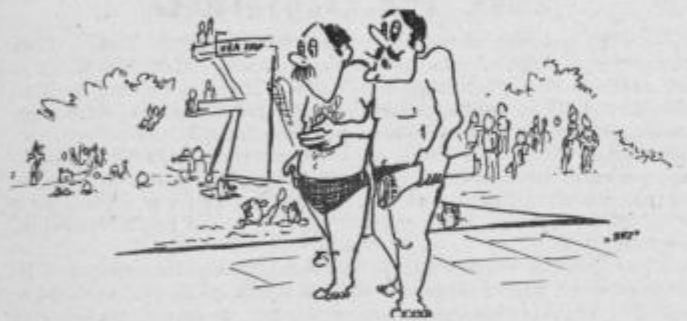
Ko sem videl, kakšna voda je v olimpijskem bazenu, se sploh nisem čudil, zakaj se nekateri rajce kopajo kar v umazani Dravi