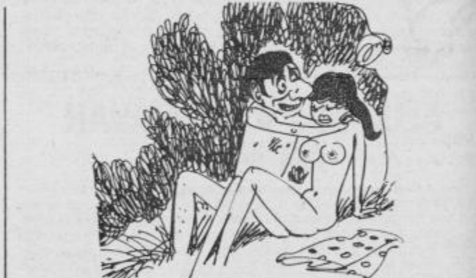
— Ljubica, ali ne bi kar tule napravila najin piknik? — Že, ampak jaz bi vseeno rada prej nekaj malega pojedla...