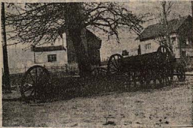
Takole vedrjo stroji trebanjske KZ že od lanske jeseni. Natrpali so jih pod drevo, da jih pereta dež in sneg. Zarjaveli bodo dočakali pomladanska dela na polju. Ne bi šlo tudi kako drugače?

da se naša občina razprostira na površini 30.829 ha, od česar odpade na rodovito zemljo 29.762 ha, na nerodovito površino pa samo 1.067 ha; da obsega rodovita zemlja 15.633 ha gozdov in 14.129 ha kmetijskih površin; da je med kmetijskimi površinami 2.371 ha pašnikov, 2 ha ribnikov in 11.756 ha obdelovalne zemlje, ki zavzema 7.518 ha njiv, 251 ha sadovnjakov, 656 ha vinogradov in 3.331 ha travnikov.