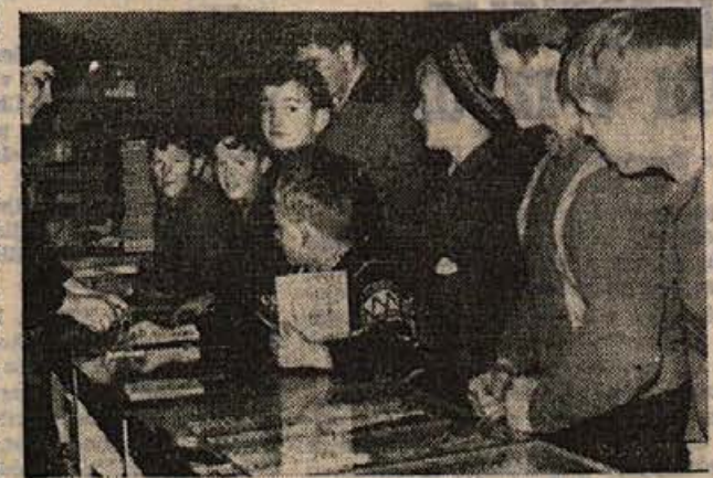
Srečali smo jih v novo opremljeni brežiški papirnici in knjižarni, zadnje dni pred polletjem: zvezek, radirka, svinčnik, črnilo, risalni listi — to so običajne želje mladih kupcev. Zdaž uživajo zaslužene počitnice in nabirajo nove moči za »drugi polčas« ...