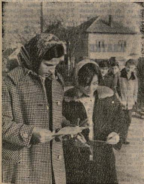
Kaže, da sta s polletnimi ocenami zadovoljni in zimske počitnice bodo čas veselja, zabave in nabiranja novih moči za drugo polletje... Takih srečanj je bilo v soboto dopoldne veliko po vsem okraju