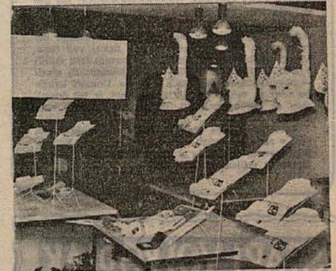
Razen tovarn NOVOTEKS, metliške BETI, Tovarne šivalnih strojev z Mirne in LISCE iz Sevnice je na zadnjem sešnju MODA 1962 razstavljala svoje izdelke tudi novomeška INDUSTRIJA PERILA. Razen lepih, sodobnih srajc so ugajale posebno praktične pižame

20. januarja so tovarno združenje »Krkko« obiskali člani počitniške zveze iz Šibenika ter takoj vrnilo obisk skupini članov Počitniške zveze te tovarne, ki so se v Šibeniku mudili larsko poletje. Gostje iz Šibenika so si ogledali mnoga podjetja v Novem mestu, spoznali partizanski Rog z znamenito Bazo 26. Gorjance in gostišča na Otočcu, v Dolenjskih ter Smarjskih Toplicah in druge znamenitosti. V Novem mestu bodo ostali do ponedeljka, 29. januarja, in v tem času videli še marsikatero posebnost, s katero se lahko ponaša Novo mesto ali njegova okolica.