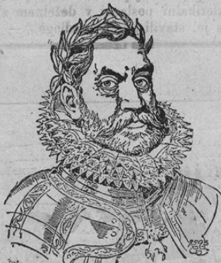
Kaiser Rudolf II. zum 300. Todestage d. Monarchen

Dne 20. januarja 1912 je bilo 300 let, odkar je v Pragi umrl cesar Rudolf II., katerega sliko danes prinašamo. Kot sin cesarja Maksimilijana II. in hčerke Karla V. bil je dne 18. julija 1552 na Dunaju rojen. Na cesarski tron je prišel pod smrti svojega očeta leta 1576. Bil je sicer talentiran, ali svet in človeštvo mu ni dopadlo in tako so prišle avstrijske dežele pod njegovim vladanjem v največjo zmedenost in vznemirjenost. Cesar