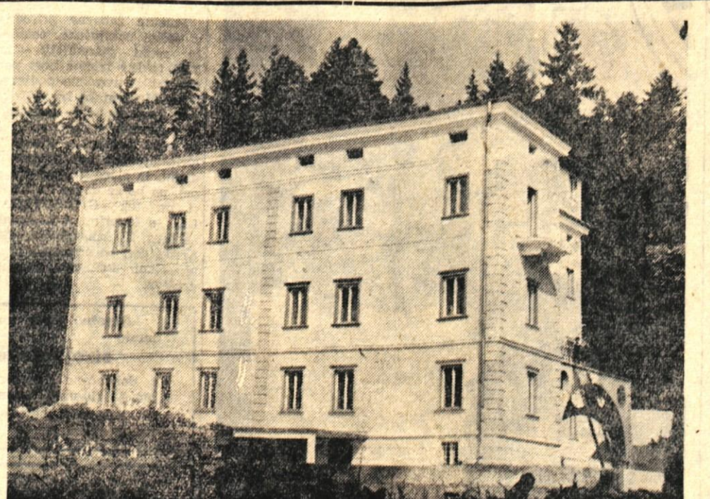
Prihodnjo soboto bo v Podvnu otvoritev adaptiranega gradu, ki bo po vsej verjetnosti kmalu imenovan izobraževalno - rekreacijski center.

Kot je znano, je za adaptacijo starega gradu poskrbel okrajni sindikalni svet Kranj in ga tako usposobil za izobraževanje in rekreacijo članov sindikata. Izven turistične sezone bodo v omenjenem objektu, ki z vso svojo ureditvijo popolnoma ustreza zahtevam za ureditev gostinskih obratov hotelskega tipa, razni tečajji in seminarji, v turistični sezoni pa bo hotel na voljo domačim in tujim gostom. V vsem letu bo tam odprta restavracija, nadalje restavracijski vrt in bife. Na restavracijskem vrtu bo okoli 350 sedežev, v restavraciji pa nekaj manj kot 100. Novi gostinski objekt razpolaga s petdesetimi ležišči, ki so razvrščena v eno-, dvo-, tro- in štiriposteljnih sobah. Predvidevajo, da se bo dnevni penzion gibal tu v mesah med 1300 in 2000 dinarjev.