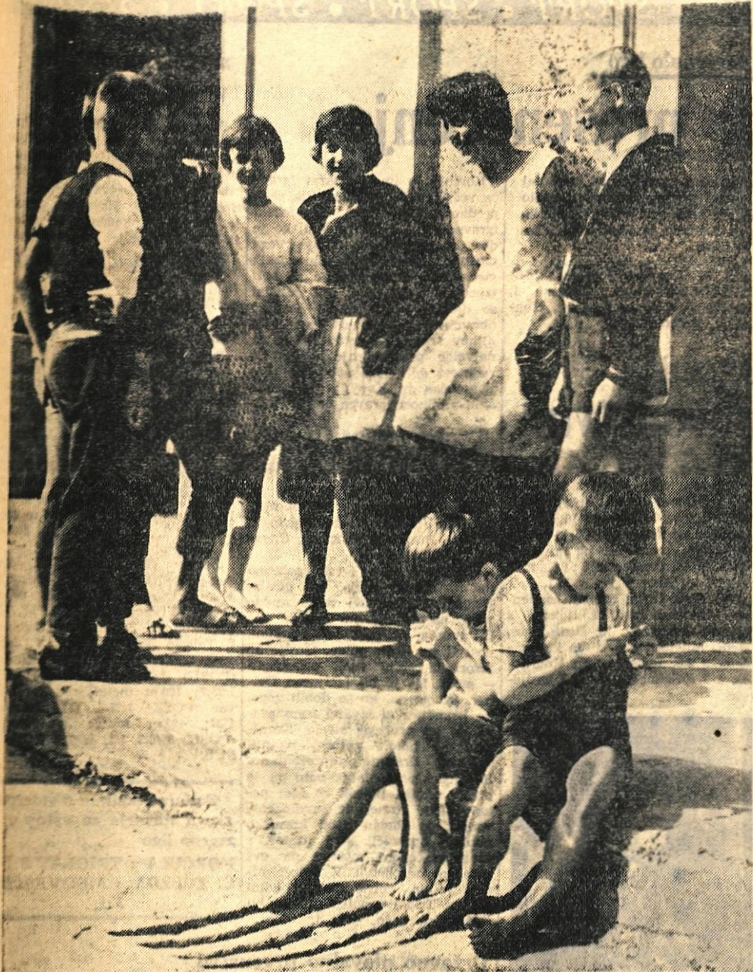
Pogovor in igra