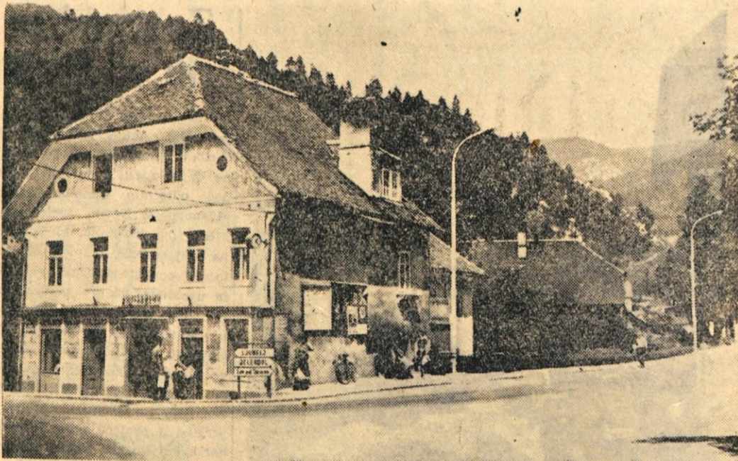
Ta posnetek iz Tržiča bo kmalu samo še zgodovinski dokument. Vse objekte na sliki bodo kmalu odstranili, namesto njih pa bodo začeli graditi trgovsko - stanovanjski center. Gradnje stanovanjske stolpnice se bodo lotili še letos