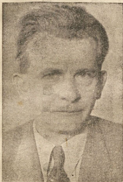
Tovariš Josip Vidmar, predsednik OF

27. april leta 1941 je bil in bo za vedno ostal mejnik v zgodovini slovenskega ljudstva. Tega dneva se je na pobudo Komunistične Partije ustanovila Osvobodilna fronta, ki je v zadnjih desetih letih vodila in vzgajala slovenski narod. Privedla ga je tako daleč, da je nehal biti hlapec in da je na svoji zemlji postal sam gospodar. Skozi deset let je bila OF učiteljica in voditeljica delovnega ljudstva na pot v boljši jutrišnji dan.