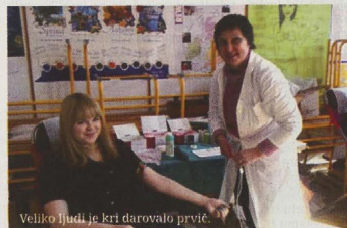
Veliko ljudi je kri darovalo prvič.

Da so plemenita dejanja zaščitni znak naše doline je potrjeno dejstvo. Vse to še dodatno izkazuje mož, ki je na omenjeni krvodajalski akciji svojo življenjsko tekočino daroval že 121.. Naj nam bo njegova iskrenost in nesebičnost v vzgled ter spodbudo tako pri darovanju krvi kot v življenju nasploh. Kajti biti človek še vedno pomeni, biti dober.