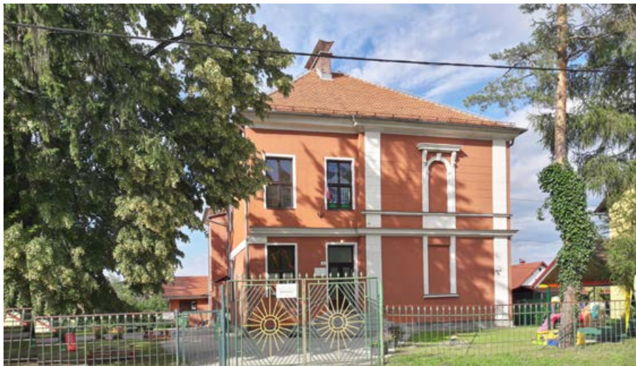
Enota Narcisa Vrtca Ptuj na Raičevi 12

Mestni svet se je s potrditvijo sklepa seznanil s pobudo za ustanovitev komisije in informacijo o izvajanju investicijskega projekta Ureditve mestne tržnice. To pobudo so vložile nekatere svetniške skupine. Cilj je raziskati ter seznaniti z dejstvi in razlogi, ki so privedli do veliko težav v obliki netransparentnega delovanja, pomanjkljivega nadzora in občutne podražitve projekta obnove mestne tržnice. Županja je z občinsko upravo pripravila informacijo o izvajanju projekta ter s tem seznanila mestni svet.