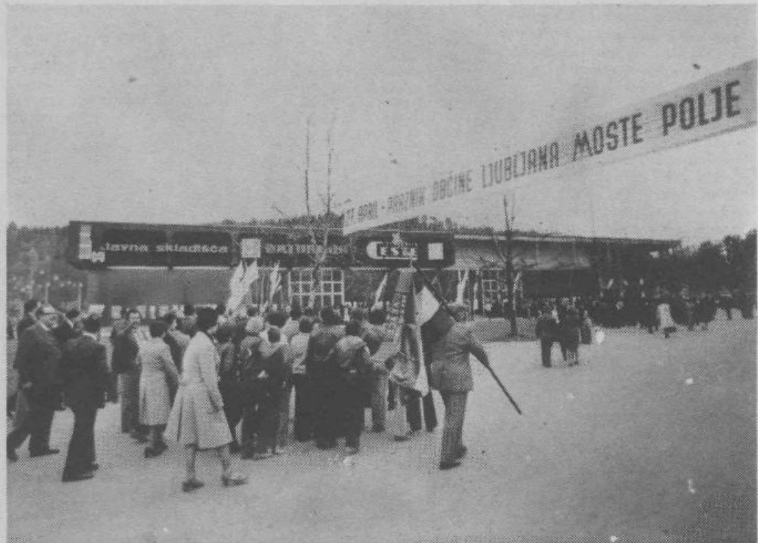
V nekaterih krajevnih skupnostih so se družno odpravili na občinsko proslavo. Na fotografiji so krajani Novih Jarš, z zastavo in slovesno razporejeni.