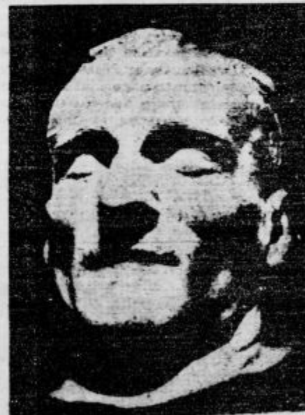
Posmrtna maska blagopokojnega kralja.

Nato je sledila topovska lafeta, ki so jo vlekli kraljevi gardisti. Ko je lafeta vozila skozi spair ljudskih množic, so se godili prizori, ki so ne dajo popisati. Vso pot je topovska lafeta spremljal glasen jok in vzkliki žalosti.