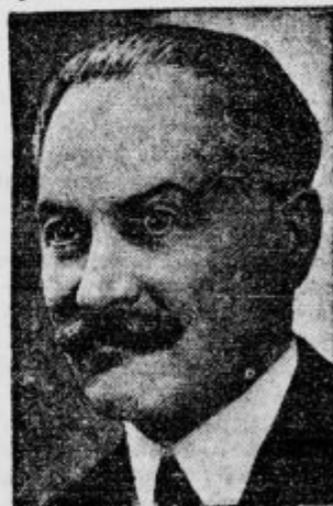
Predsednik francoske republike Lebrun, ki se je osebno udeležil pogreba.

vrstile delegacije državnih oblasti in organizacij, ki so se v nemi žalosti poslednjič poklonile zemeljskim ostankom svojega mrtvega kralja. Nato pa je izkazala zadnjo čast svojemu gospodarju