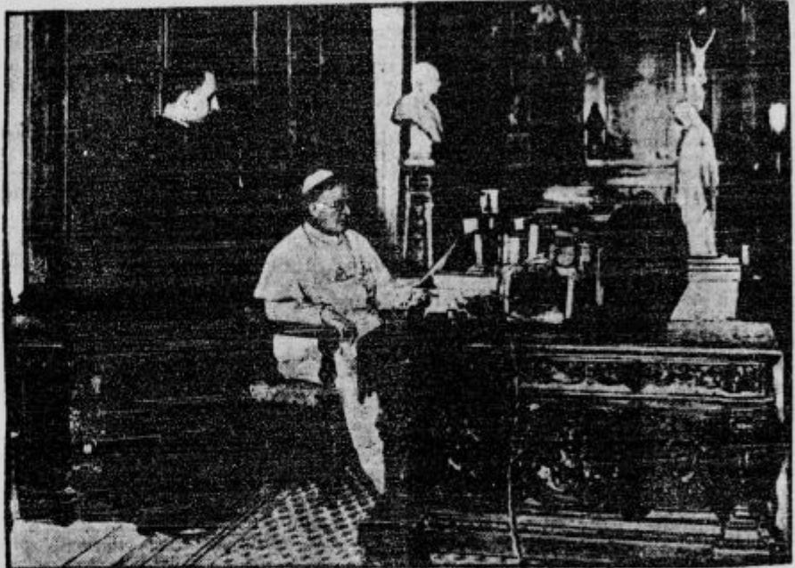
Sv. Oče govori po radiu besede miru in blagoslova zborovalcem na svetovnem evharističnem kongresu v Buenos Airesu.