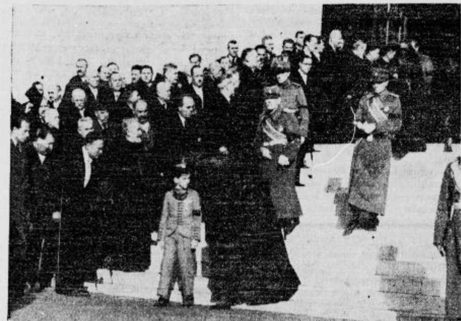
Kraljeva družina v pogrebem sprevedu: Nj. Vel. kralj Peter II. s svojo materjo, kraljico Marijo, in ostali člani kraljevskega doma zapuščajo saborno cerkev v Belgradu.

Po končanem mimohodu so krsto dvignili ter jo poneli skozi ogromno množico naroda in vojaštva v dvorsko čakalnico. Za krsto se šli Nj. Vel. romunski kralj Karel, bolgarski princ Kiril, Nj. Vis. knez Jurij, predsednik francoske republike Lebrun, vojvoda Spoletski in adjutant Nj. Vel. kralja. Dvignejo krst z zemskimi ostanki kralja, vsi vojaki in častniki stopijo mirno in pozdravijo, visoki dostojanstveniki jemljejo slovo od kralja Aleksandra. Tiho prihaja h krsti patriarh Varnava