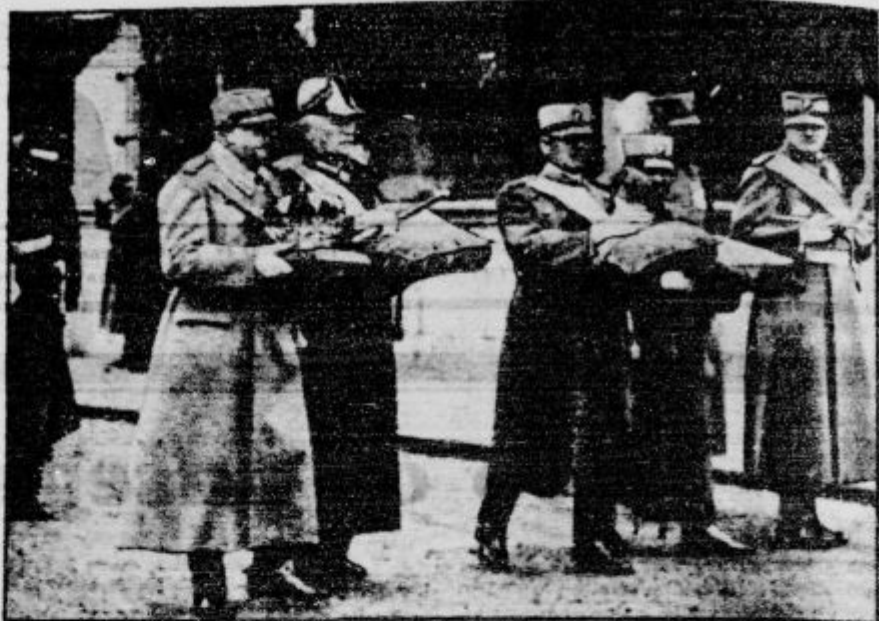
Pred kruno so častniki nosili krono, vezlo, državno jabolko in maršalsko palico blagopokojnega kralja Aleksandra I.

Nato sta dva častnika kraljeve garde petjala kraljevega konja Maltezarja, ki je desetkrat nosil svojega vladarja pri vseh vojskih prireditvah. Kraljevemu konju je sledilo 19 avtomobilov-kamionov, ki je peljalo 15.000 vencev. Med njimi je bilo 150 srebrnih vencev. Zelo muzogo je bilo tudi trajevih vencev. Na zadnjem avtomobilu so peljali ogromen venec, ki ga je daroval Split in ki je bil