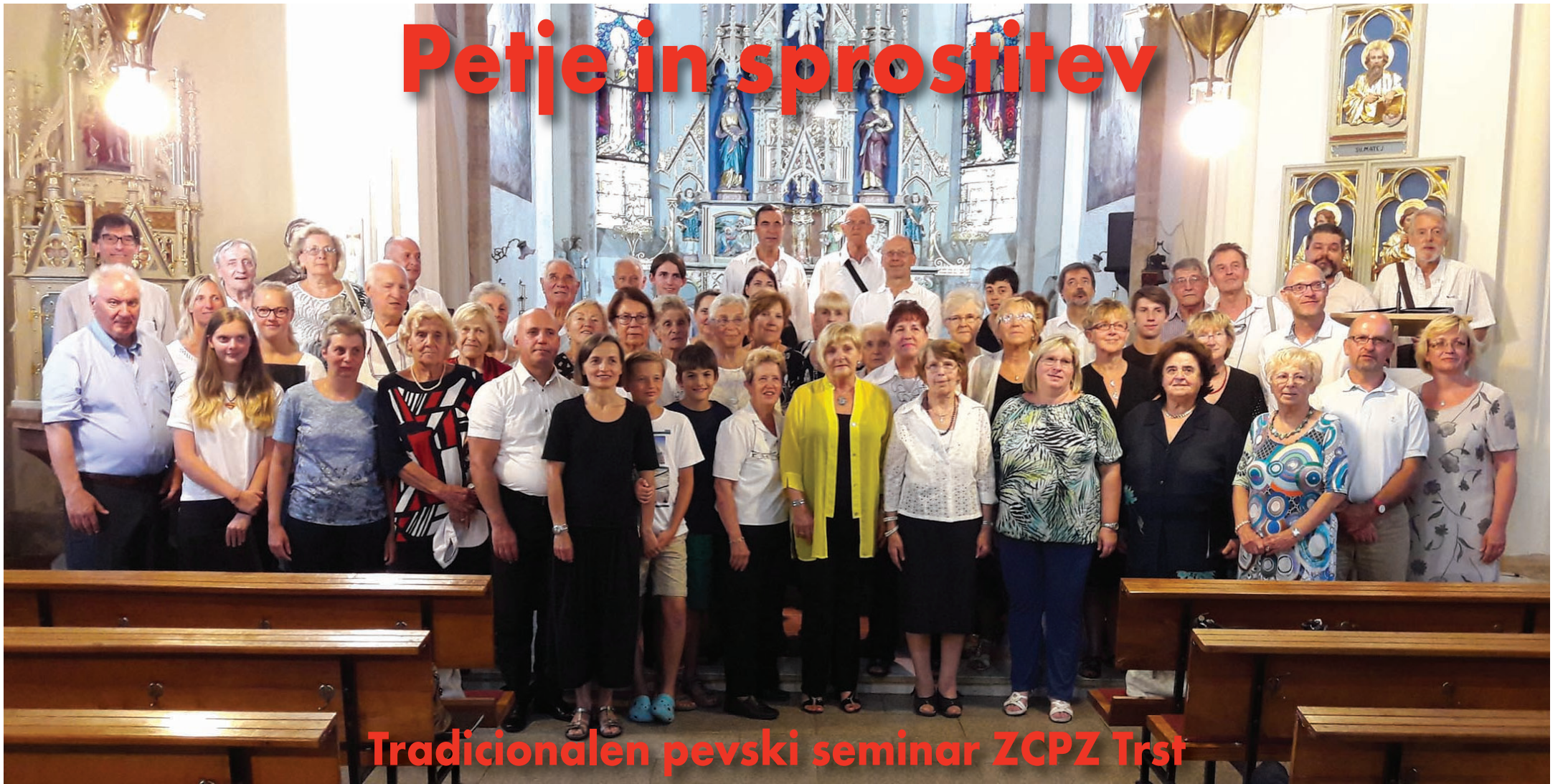
Tradicionalen pevski seminar ZCPZ Trst